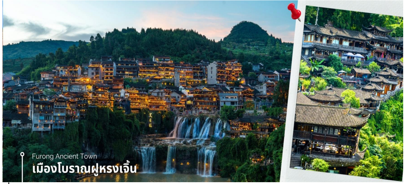
Furong Ancient Town เมืองโบราณฝูหรงเจิน

เช้า รับประทานอาหารเช้า ณ ห้องอาหารของโรงแรมที่พัก (4) หลังอาหารเช้า นำท่านเดินทางสู่เมืองฝูหรงเจิน โดยใช้เวลาเดินทางประมาณ 1.5 ชั่วโมง นำท่านเที่ยวชม เมืองโบราณฝูหรงเจิน เมืองโบราณเก่าแก่ที่ขึ้นชื่อ ของมณฑลหูหนานเป็นสถานที่ท่องเที่ยวระดับ AAAA ที่ได้รับความนิยมจากนักท่องเที่ยวผู้รักกับเมืองโบราณฟ่งหวง เคยเป็นสถานที่ถ่ายทำภาพยนตร์เรื่อง ฝูหรงเจิน ทำให้สถานที่แห่งนี้ได้รับความนิยมจากนักท่องเที่ยว จุดไฮไลท์ของเมืองโบราณแห่งนี้ นอกจากบ้านเรือนโบราณที่เป็นเอกลักษณ์เฉพาะของ มณฑล หูหนาน ที่นี่ยังมีน้ำตกที่สวยงามกลางเมืองที่เป็นจุดเช็คอินยอดนิยมสำหรับนักท่องเที่ยว นำท่านล่องเรือชมความงามของเมืองโบราณและน้ำตกที่ไหลผ่านบริเวณเมืองโบราณ ซึ่งเป็นการเพิ่มเสน่ห์ให้กับเมืองโบราณแห่งนี้