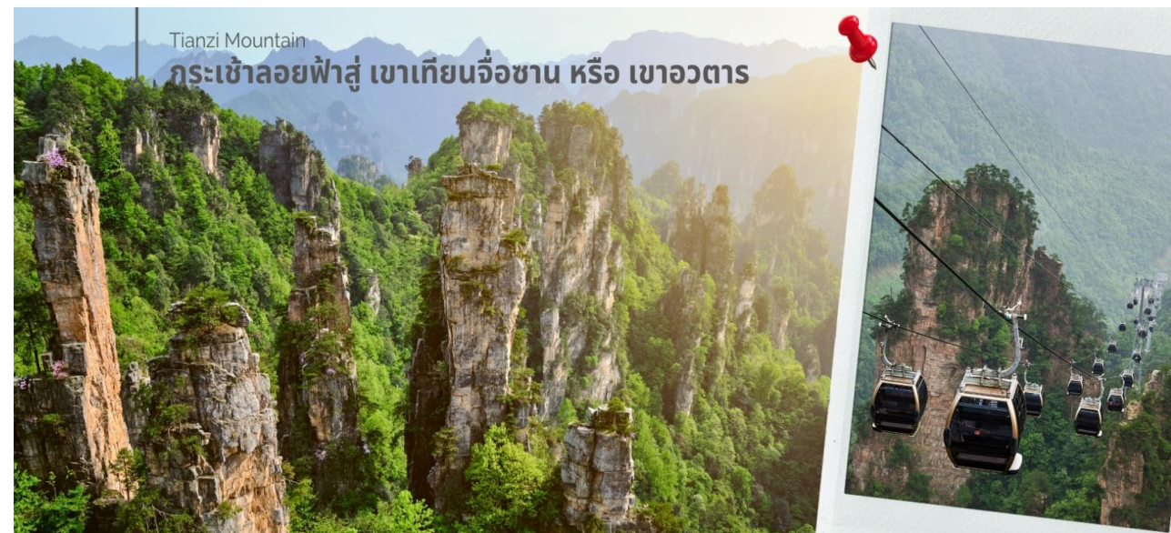
Tianzi Mountain กระเช้าลอยฟ้าสู่ เขาเทียนจื่อซาน หรือ เขาอวตาร

จากนั้นนำท่านเปิดประสบการณ์ การโดยสาร กระเช้าลอยฟ้าสู่ เขาเทียนจื่อซาน หรือ เขาอวตาร (รวมค่ากระเช้า และลิฟต์แก้ว) ตื่นตาตื่นใจกับยอด เขาฮาลีลูย่า ที่มีความสูงถึง 1,250 เมตร ชมทิวทัศน์อันสวยงามที่สุดแสนประทับใจของจางเจียเจี๋ย ทั้งด้านทิศ