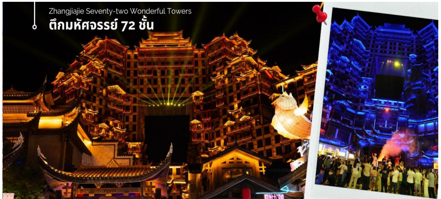
Zhangjiajie Seventy-two Wonderful Towers

20.25 น. เดินทางถึงท่าอากาศยานเมืองจางเจียเจี๋ย หลังผ่านพิธีการตรวจคนเข้าเมือง และรับกระเป๋าสัมภาระเรียบร้อยแล้ว นำท่านเดินทางโดยรถโค้ชปรับอากาศเข้าสู่เมือง จางเจียเจี๋ย เป็นประดุดั้งดินแดนบริสุทธิ์ของโลก ตั้งอยู่ทางภาคตะวันตกเฉียงเหนือของมณฑลหูหนาน เป็นหนึ่งในเมืองท่องเที่ยวที่สำคัญที่สุดมีชื่อเสียงทางด้านทรัพยากรการท่องเที่ยวที่มีเอกลักษณ์ของตนเอง ชมตึกมหัศจรรย์ 72 ชั้น จุดเช็คอินใหม่ล่าสุดของเมืองจางเจียเจี๋ย โดยการสร้างตึกในครั้งนี้เป็นการรวมเอาจุดเด่นของเมืองจางเจียเจี๋ยกับวัฒนธรรมการสร้างบ้านเรือนของชาวพื้นเมืองฉู่เจียมารวมกันโดยอาคารสูงที่สร้างจำลอง เขาเทียนเหมินซานหรือประตูสวรรค์ และ บ้านยกพื้นโบราณที่เป็นบ้านพื้นเมืองของชาวฉู่เจีย ภายในบริเวณตึก 72 ชั้น ยังรวบรวม รีสอร์ท ร้านอาหาร สตรีทฟู้ด ร้านขายของที่ระลึก ที่