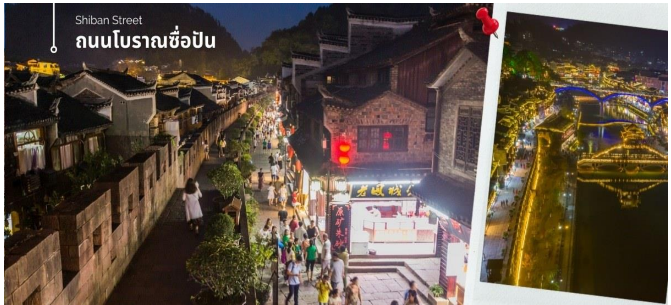
Shiban Street ถนนโบราณช้อป

CVZDYG1 จางเจียเจีย-ฝูหรงเจิน-เมืองโบราณเฟิ่งหวง-หุบเขาอวตาร-ประตูสวรรค์ 6วัน 5คืน บิน VZ (ไม่ลงร้านรัฐบาล)