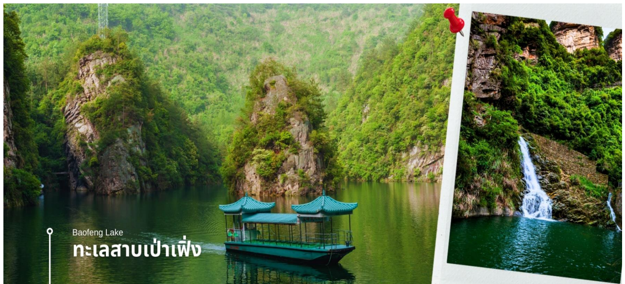
Baofeng Lake ทะเลสาบเป่าเฟิ่ง

นำท่านเดินทางสู่ ทะเลสาบเป่าเฟิ่งหู (รวมค่าล่องเรือ) ล่องเรือชมวิวทิวทัศน์ของเทือกเขา ท่ามกลางสายน้ำและม่านหมอก สัมผัสกับธรรมชาติอันงดงาม ความเขียวชอุ่มของป่าไม้ อากาศที่บริสุทธิ์ น้ำที่ใสสะอาด และภูเขาหินรูปร่างแปลกตา ในบางช่วงเวลางจะมีชาวผู้เจีย มาร้องเพลงขับขานให้ฟังอีกด้วย