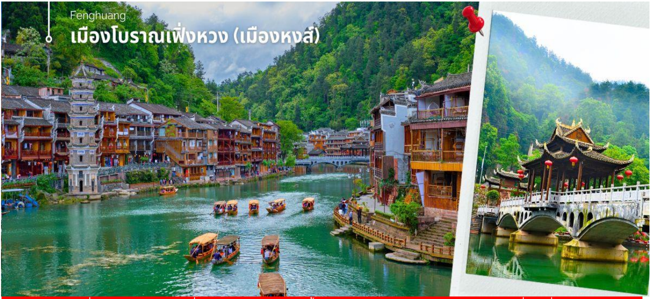
(หมายเหตุ : กรณีที่ไม่สามารถล่องเรือได้ เนื่องจากสภาพอากาศไม่เอื้ออำนวย รถติด ท่าเรือปิด หรือรัฐบาลมีกำหนดสั่งปิด สั่งงดโดยยึดตามความเหมาะสมเป็นหลัก ทางบริษัทฯ ขอสงวนสิทธิ์ไม่คืนเงินและไม่แจ้งให้ทราบล่วงหน้า)

ชมสะพานหงเจียว สะพานไม้โบราณที่มีหลังคาคลุมเหมือนสะพานข้ามคลองในเวนิส สะพานแห่งนี้เคยเป็นด่านเก็บภาษีเกลือในสมัยราชวงศ์ชิง ซึ่งยังคงรักษารูปทรงในอดีตไม่เปลี่ยนแปลง ชมจัตุรัสหงส์ ที่มีรูปนกหงส์จำลองที่ทำจากทองเหลือง อันเป็นสัญลักษณ์ที่โดดเด่นของเมืองโบราณแห่งนี้