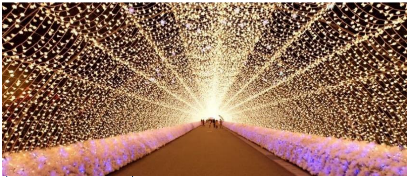
ค่า อีสรอาหาร ตามอัยาศัยเพื่อสะดวงแก่การท่องเทียว ที่พัก TOYOKO INN NAGOYA MEIEKI หรือเทียบเท่า

มีการประดับไฟบนน้ำ ให้นักท่องเที่ยวได้เดินชมกันเพลินๆ ท่ามกลางอากาศเย็นสบายในฤดูหนาว และห้ามพลาดกับ อุโมงค์ไฟระยิบระยับ หรือ TUNNEL OF LIGHT ในระยะทางกว่า 200 เมตร ตลอดเส้นทางจะล้อมรอบไปด้วยดวงไฟรูปดอกไม้น่ารักๆ และก็ยังมียุโมงค์ไฟที่เปลี่ยนสีได้อีกด้วย