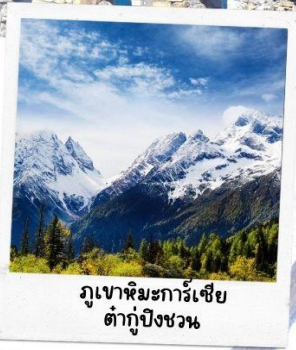
ภูเขาหิมะการ์เซีย ต้ากู่ปิงชว่น