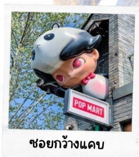
ชอยกวางแคบ