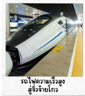
รถไฟความเร็วสูง สู่จิวจ้ายโกว