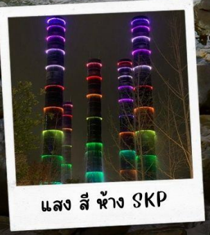
แสง สี ห้าง SKP