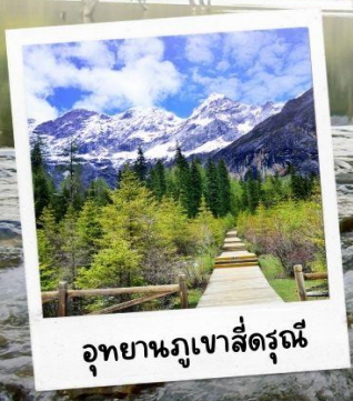
อุทยานภูเขาสี่ตรุณี