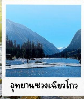
อุทยานชวงเจียวโกว