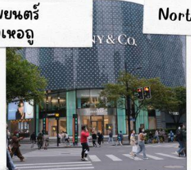
ถนนคนเดินหวงไห่