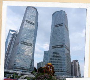
ย่านลู่เจียจู่ย