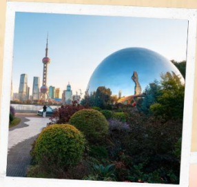
North bund green land