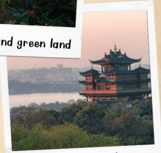
หอเจิ้งหวงเก้อ