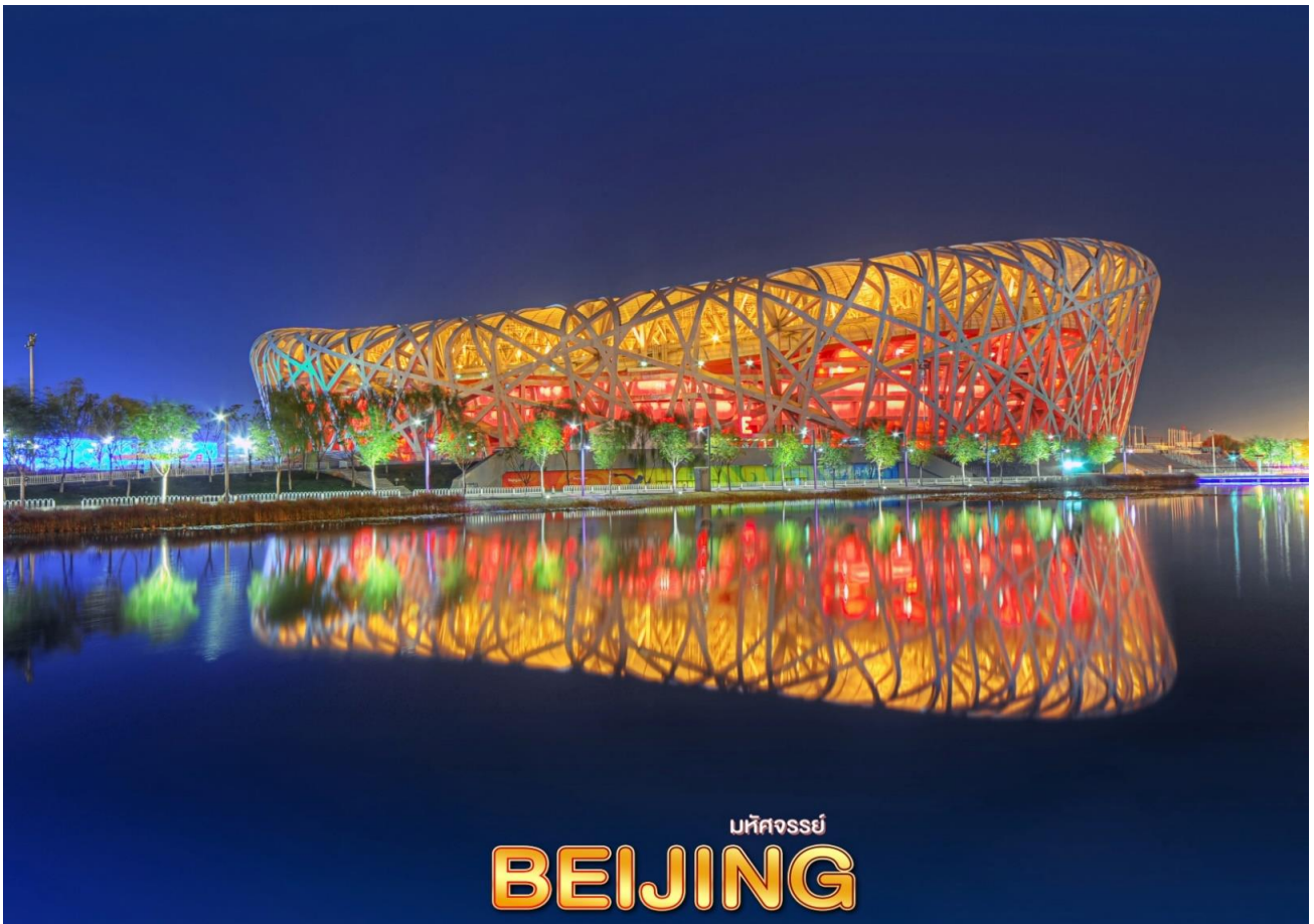
มหัศจรรย์ BEIJING

จากนั้น นำท่านแวะ ร้านยางพารา และผ่านชม สนามกีฬาฟาร์รงก และ วอเตอร์ คิวบ์ (Water Cube) ซึ่งเคยใช้เป็นศูนย์แข่งขันกีฬาโอลิมปิกในปี 2008 ต่อมามีการปรับปรุงพัฒนาให้เป็นสวนน้ำสุดทันสมัย ซึ่งปลดปล่อยจินตนาการสู่โลกมหัศจรรย์ใจกลางเมือง แนวคิดของ Water Cube สวนน้ำสุดล้ำแห่งนี้ได้รับแรงบันดาลใจมาจากฟองสบู่ที่ก่อตัวติดกันเป็นฟองเล็กฟองน้อยจนเกิดเป็นสุดยอดนวัตกรรมขึ้นมา