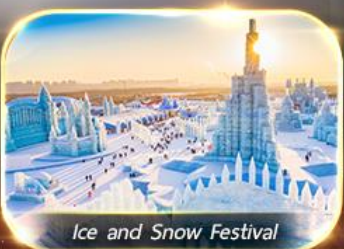
Ice and Snow Festival