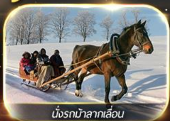
นั่งรถม้าลากเลื่อน

ฟรีนั่งรถม้าลากเลื่อน ชมโชว์ว่ายน้ำแข็ง แม่น้ำซงหว่าเจียง