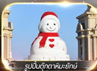
รูปปั้นตุ๊กตาหิมะยักษ์