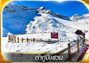
ต้ากู่ปิงชว่น