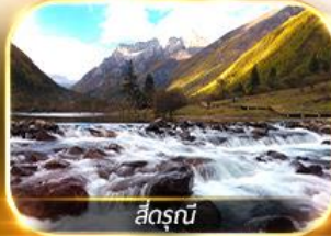
สี่ดรุณี