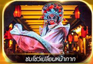
ชมโชว์เปลี่ยนหน้ากาก

ชมทัศนียภาพดั่งสวรรค์ จิว่โจ้วโกว ภูเขาหิมะการเซี่ยต้ากู่ปิงชว่น หวงหลง ชวงเจียวโกว สี่ดรุณี เจริญ นักรบไฟความเร็วสูง วัตตาดำนิ้อ ถนนคนเดินซุนชี่ฮู่ โชว์เปลี่ยนหน้ากาก แหล่งช้อปปิ้งสุดฮิต POP MART