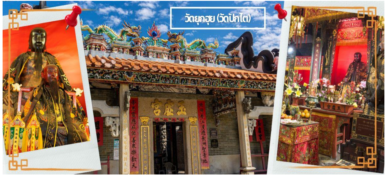
วัดห่านโหมว (วัดปักโต)

กลางวัน 🕒 บริการอาหารกลางวัน ณ ภัตตาคาร (6) จากนั้นนำท่านเดินทางสู่ วัดปักโต เป็นสถานศักดิ์สิทธิ์ที่มีประวัติมายาวนาน 160 ปี ในเขต WAN CHAI เป็นวัดที่บูชาเทพเจ้าแห่งท้องทะเลในลัทธิเต๋า และชาวฮ่องกงเชื่อกันว่าผู้ใดที่เกิดปีชง หากมาทำการแก้ดวงชะตาแก้ชงประจำปีที่นี่ จะทำให้ร้ายกลายเป็นดีได้ และที่วัดยังมี “เทพเจ้าเปลี่ยนใจ” ที่นิยมมาขอพรให้เรื่องที่ไม่ดีกลายเป็นเรื่องดี หรือคนที่ศัตรูของเราเปลี่ยนใจมาเป็นมิตร จึงเป็นที่นิยมอย่างมากของชาวท้องถิ่น