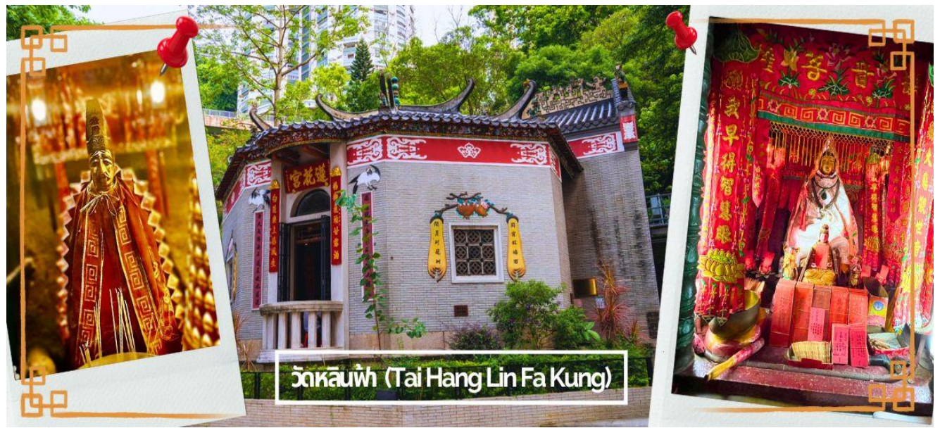
วัดหลินฟา (Tai Hang Lin Fa Kung)

CHBH6 ส่องกง-ไหว้พระ 9 วัดดัง-พิธีเยี่ยมเงินวันเปิดท้องพระคลัง 4 วัน 2 คืน บิน Greater Bay Airlines (HB)