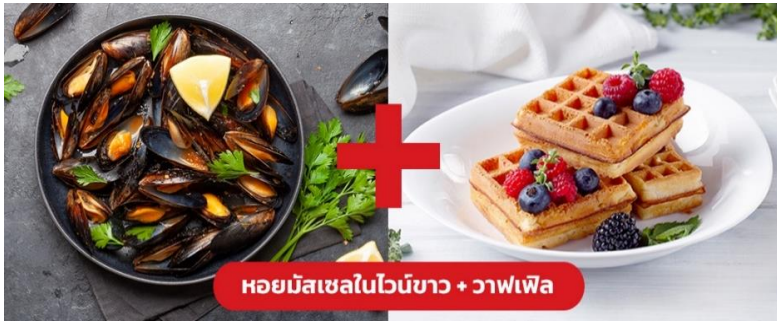
หอยมัสเซลในไวน์ขาว + วาฟเฟิล

Highlight! หอยมัสเซลอบมาในซอสไวน์ขาวสุดกลมกล่อมผสานกับความหวานของหอย เสิร์ฟพร้อมคู่กับเบลเยียม วาฟเฟิล (Belgain Waffle) เป็นเมนูตัดเลี่ยนที่ทานแล้วลงตัวสุดๆ 😊