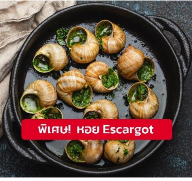
พิเศษ! หอย Escargot