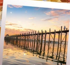
สะพานไม้อูบิง