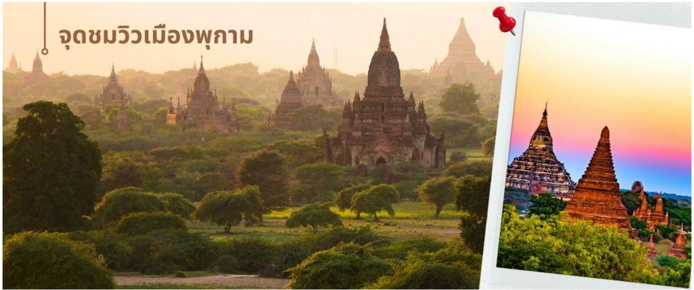
จุดชมวิวมืองพุกาม

เช้า บริการอาหารเช้า ณ ห้องอาหารของโรงแรม (2) นำท่านเดินทางสู่ จุดชมวิวมืองพุกาม ให้ท่านได้ถ่ายภาพทุ่งทะเลเจดีย์แห่งเมืองพุกามที่กว้างใหญ่และสวยงามสวยงาม พุกามได้ชื่อว่าเป็น "เมืองแห่งทะเลเจดีย์" หรือ "ดินแดนแห่งเจดีย์" เพราะในช่วงรุ่งเรืองเคยมีเจดีย์มากมายที่ถูกสร้างขึ้นบนที่ราบพุกาม เจดีย์แห่งแรกของพุกามคือ เจดีย์ชเวสิกอง สร้างโดยพระเจ้าอโนธามังช่อ ปฐมกษัตริย์แห่งอาณาจักรพุกาม โดยธรรมเนียมการสร้างเจดีย์ เจดีย์องค์ใหญ่สุดจะเป็นเจดีย์ที่กษัตริย์ทรงสร้าง และองค์ที่มีขนาดเล็กถัดมาเป็นการสร้างโดยเหล่าขุนนางอำมาตย์ ลดหลั่นลงมาตามบรรดาศักดิ์ นอกจากเจดีย์ชเวสิกองแล้ว ยังมีเจดีย์สำคัญ ๆ อีกหลายองค์และวัดสำคัญ ๆ อีกเช่น เจดีย์ชเวซานดอ, อานานดาพะยา, มินกะลาเซตี, วัดที่โลมินโล, วัดตะมะยานจี, วัดตะบะญู เป็นต้น