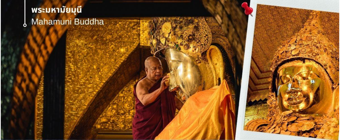
พระมหาชัยมุณี Mahamuni Buddha

เป็นพระพุทธรูปที่มีชีวิต ด้วยเหตุที่ได้รับประทานพร หรือบางตำนานก็กล่าวว่าได้รับประทานลมหายใจจากพระพุทธเจ้า จึงมีประเพณีล้างพระพักตร์ถวายโดยทุกเช้าในเวลาประมาณ 04.00 น. พระมหาเถระและสาธุชนทั่วไปที่ศรัทธาจะมาทำพิธีล้างพระพักตร์ด้วยน้ำอบน้ำหอมผสมทานาคาอย่างดี พร้อมกับใช้แปรงทองแปรงที่พระโอษฐ์เสมือนหนึ่งแปรงพระทนต์ถวายพระพุทธเจ้า ก่อนใช้ผ้าจากศรัทธาสาธุชนที่ถวายมาเช็ดจนแห้งสนิท แล้วนำกลับคืนแก่สาธุชนผู้นั้นไปบูชาต่อ พร้อมใช้พัดทองโบกถวายเป็นอันดี เสมือนหนึ่งได้อุปัฏฐากองค์สมเด็จพระสัมมาสัมพุทธเจ้าที่ยังทรงพระชนม์ชีพอยู่ พระมหาชัยมุณีมีอีกพระนามหนึ่งว่า "พระเนื่อนิม" ซึ่งเกิดจากการปิดทองซ้ำแล้วซ้ำอีกจนเป็นรอยย่นตะปุ่มตะป่ำไปทั่วทั้งองค์ ซึ่งหากเอานิ้วกดลงไปจะรู้สึกได้ถึงความอ่อนนิ่มของทองคำเปลวที่ปิดทับซ้อนกันนับเป็นพัน ๆ ชั้น สมควรแก่เวลานำท่านเดินทางกลับเข้าสู่ที่พัก