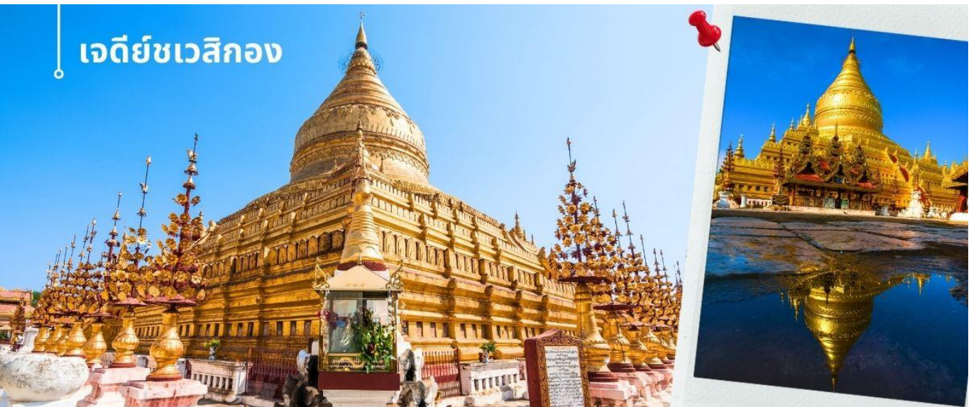
เจดีย์ชเวสิกอง

นำท่านนมัสการ เจดีย์ชเวสิกอง (1 ใน 5 มหาสถานอันศักดิ์สิทธิ์ของชาวพม่า) เชื่อกันว่าเจดีย์ชเวสิกอง เป็นที่ประดิษฐานพระสารีริกธาตุและพระทันตธาตุของพระโคตมพุทธเจ้า พระเจดีย์มีรูปทรงระฆังคว่ำมีการปิดประดับทองคำเปลว ฐานเจดีย์มีหลายชั้น เจดีย์เป็นทรงตัน ฐานระเบียงเจดีย์มีแผ่นภาพเคลือบปูนปั้นเล่าเรื่องในนิทานชาดก ที่ทางเข้าของเจดีย์มีรูปปั้นขนาดใหญ่ของผู้ปกป้องศาสนสถาน บริเวณโดยรอบล้อมด้วยวิหารและศาลเจ้าขนาดเล็ก นอกจากนี้ยังมีพระพุทธรูปสัมฤทธิ์สีทองของพระพุทธเจ้าในภัทรกัปนี้ทั้งสี่ทิศ ที่ด้านนอกเขตเจดีย์มีวิหารนะ 37 ตน โดยมีท้าวสักกะหรือพระอินทร์เป็นหัวหน้านะ สร้างจากไม้แกะสลักอย่างประณีตตามแบบศิลปะพม่า บริเวณเจดีย์ชเวสิกอง ยังมีเสาหินที่จารึกเป็นภาษามอญในสมัยพระเจ้าจันซีตา