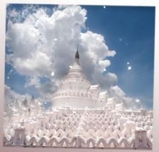
เจดีย์ชินพิวมิน

ชมวิวทะเลเจดีย์ ล่องแม่น้ำอิรวดี สักการะมหาเจดีย์ชเวสิกอง ร่วมพิธีล้างหน้าพระพักตร์พระมหาชัยมุณี