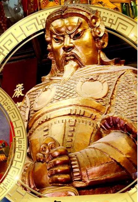
วัดเชกกง