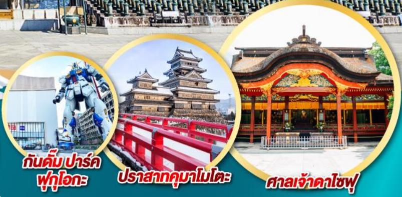
กันดั้มปาร์ค ฟุกุโอกะ

28 ธ.ค. 67-01 ม.ค. 68 30 ธ.ค. 67-03 ม.ค. 68