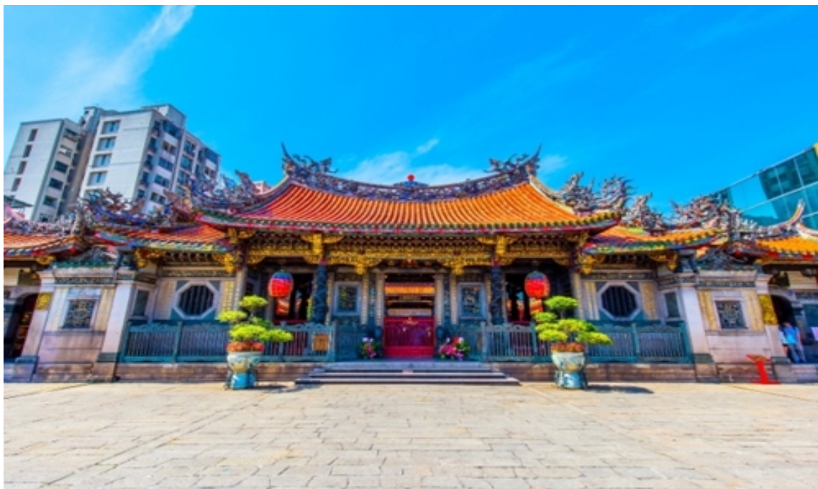
อิสระรับประทานอาหารกลางวัน

ได้เวลาอันสมควรนำท่านเดินทางสู่สนามบินเถาหยวน