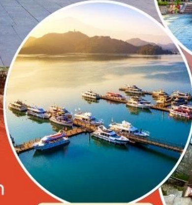
ทะเลสาบสุริยอันจินทรา