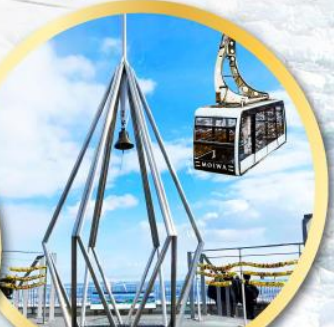
นั่งกระเช้าชมวิวเมืองซัปโปโร MT.MOIWA