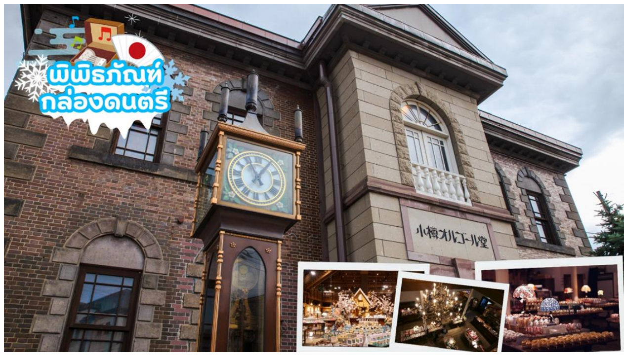
จากนั้นมุ่งสู่ พิพิธภัณฑ์กลองดนตรี พิพิธภัณฑ์กลองดนตรีโอตารุเป็นหนึ่งในร้านค้าที่ใหญ่ที่สุดของพิพิธภัณฑ์กลองดนตรีในญี่ปุ่น โดยตัวอาคารมีความเก่าแก่สวยงาม และถือเป็นสถานที่สำคัญทางประวัติศาสตร์ของเมือง