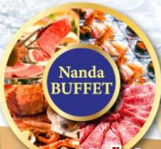
พิเศษบุฟเฟ่ต์บั้งย่าง ร้าน NANDA

ชม 2 เทศกาล Sounkyo Ice Fall Festival 2025 Sapporo Snow Festival 2025