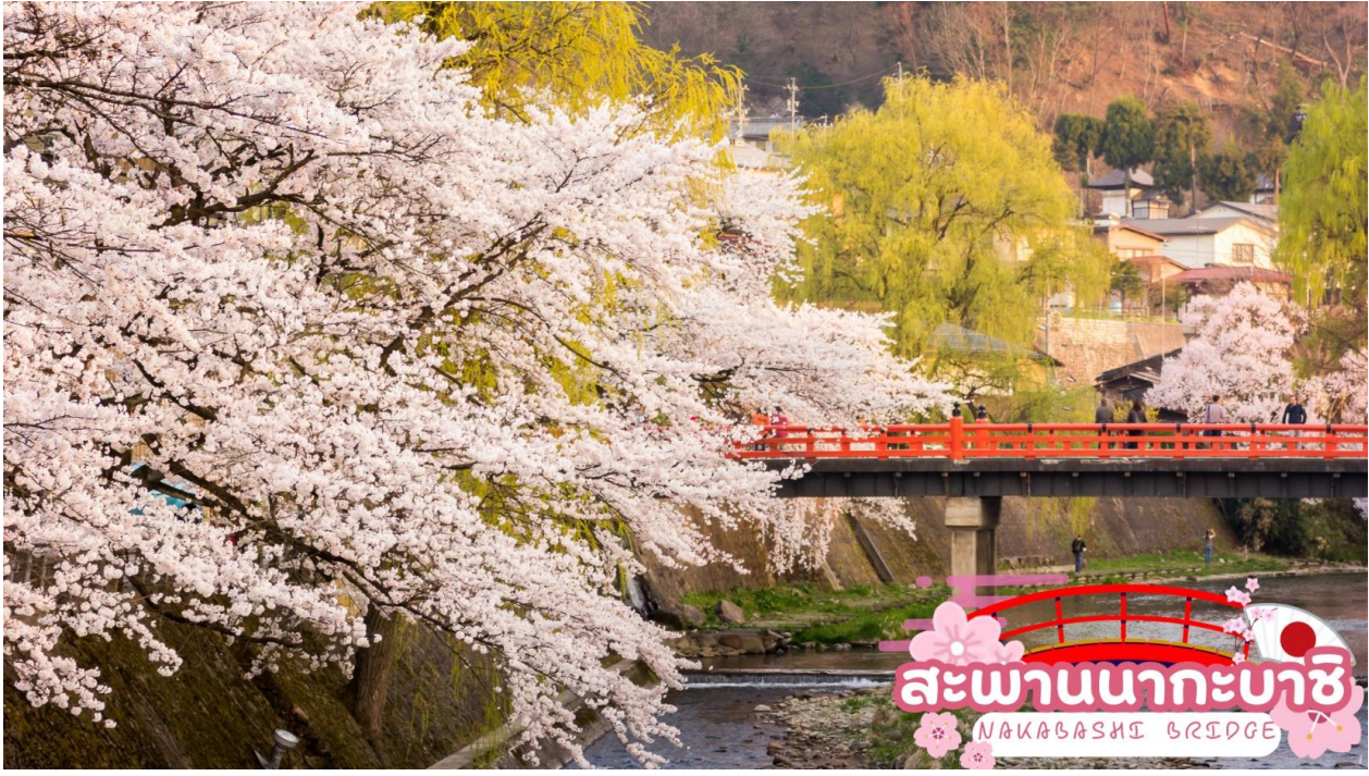
สะพานนาคะบาชิ NAKABASHI BRIDGE

ผ่านชม ทาคายาม่า จินยะ หรือ ที่ว่าการอำเภอเก่าเมืองทาคายาม่า (ไม่รวมค่าเข้าชม) ซึ่งเป็นจวนผู้ว่าแห่งเมืองทาคายาม่า เป็นที่ทำงานและที่อยู่อาศัยของผู้ว่าราชการจังหวัดฮิดะ เป็นเวลากว่า 176 ปี ภายใต้การปกครองของโชกุนตระกูลกุกาวา ในสมัยเอโดะ ตัวอาคารเป็นทั้งสถานที่ราชการ ห้องรับแขก ห้องประชุม รวมถึงห้องสอบสวนอีกด้วย