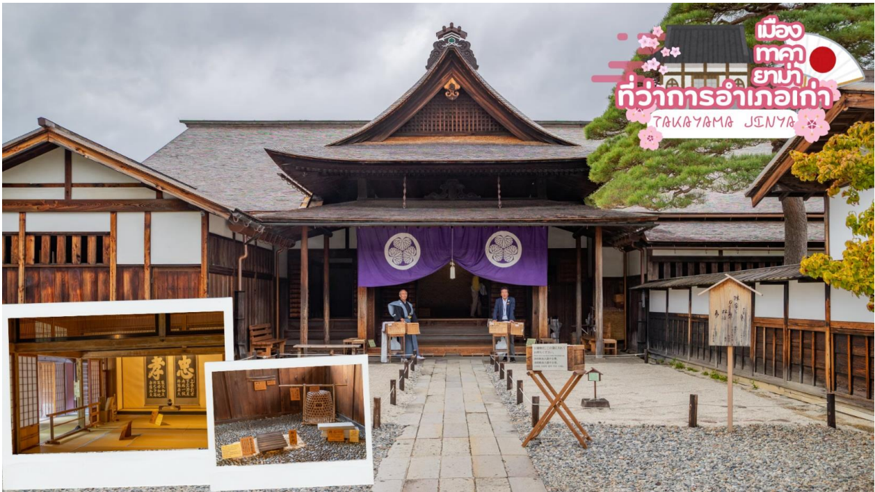
เมืองทาคายาม่า ที่ว่าการอำเภอเก่า TAKAYAMA JINYA

ผ่านชม ทาคายาม่า จินยะ หรือ ที่ว่าการอำเภอเก่าเมืองทาคายาม่า (ไม่รวมค่าเข้าชม) ซึ่งเป็นจวนผู้ว่าแห่งเมืองทาคายาม่า เป็นที่ทำงานและที่อยู่อาศัยของผู้ว่าราชการจังหวัดฮิดะ เป็นเวลากว่า 176 ปี ภายใต้การปกครองของโชกุนตระกูลกุกาวา ในสมัยเอโดะ ตัวอาคารเป็นทั้งสถานที่ราชการ ห้องรับแขก ห้องประชุม รวมถึงห้องสอบสวนอีกด้วย