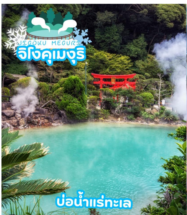
บ่อน้ำแร่ทะเล

ได้เวลาอันสมควรนำท่านเดินทางสู่ เมืองเบปปุ (Beppu) เมืองในจังหวัดโออิตะ (OITA) ตั้งอยู่บนชายฝั่งทะเลตะวันออกของเกาะคิวชู ประเทศญี่ปุ่น เป็นเมืองท่องเที่ยวแช่น้ำพุร้อนยอดนิยมของญี่ปุ่น จัดเป็นเมืองที่มีรีสอร์ทน้ำแร่มากที่สุด นักท่องเที่ยวนิยมมาแช่ออนเซ็นหรืออบทรายร้อนริมทะเลที่เมืองนี้