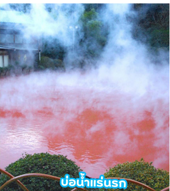
บ่อน้ำแร่บุกร

GO2FUK-VZ006 – KYUSHU KUMAMOTO OITA SKI WINTER 5D3N VZ