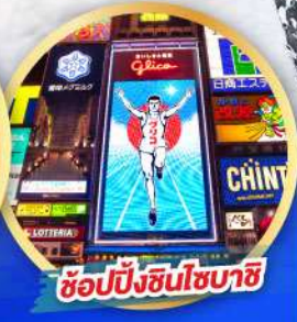
ซัปปิงชินโซบาชิ

เดินทาง 14-19, 21-26 ม.ค. 68 06-11, 13-18 ก.พ. 68 13-18 มี.ค. 68