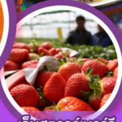
เก็บสตอร์วเบอร์รี่

เดินทาง 04-09, 06-11 ก.พ. 68 14-19, 18-23 ก.พ. 68