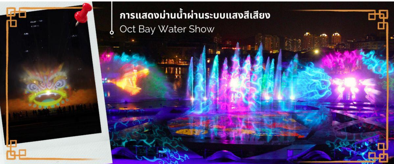
การแสดงม่านน้ำผ่านระบบแสงสีเสียง Oct Bay Water Show

จากนั้นนำท่าน ชมการแสดงม่านน้ำผ่านระบบแสงสีเสียง OCT BAY WATER SHOW เป็นโชว์ม่านน้ำแบบ 3 มิติ ที่ใช้ทุนสร้างกว่า 200 ล้านบาท จัดแสดงที่ OCT BAY Water Show Theatre Shenzhen ซึ่งเป็นโรงละครทางน้ำขนาดใหญ่ที่สามารถจุได้ถึง 2,595 คน เป็นโชว์ที่เกี่ยวกับเด็กหญิงผู้กล้ากับลิงพิเศษที่ออกตามหาเครื่องบรรเลงเพลงที่มีชื่อว่าปิกแห่งความรัก เพื่อเอามาช่วยนกที่ถูกทำลายจากมนต์ (มลพิษ) ในป่าโกกก่าง การแสดงใช้อุปกรณ์ เช่น แสงเลเซอร์ ไฟ เครื่องเป่าแสง ม่านน้ำ ระเบิดน้ำ กว่า 600 ชนิด เป็นโชว์น้ำที่ใหญ่ และทันสมัยที่สุดในโลก