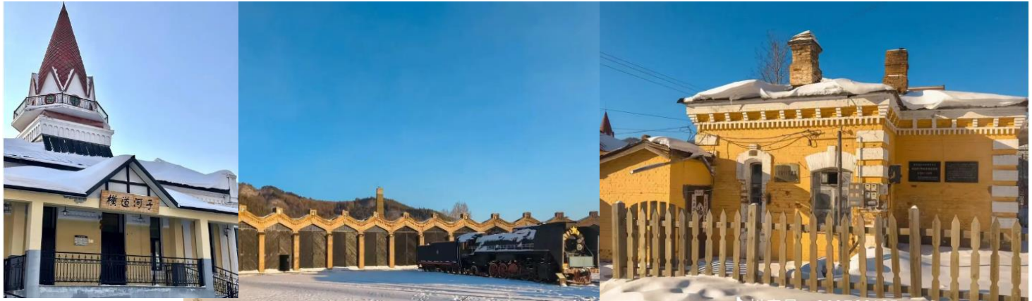
ลงตัวอีกด้วย

เก่าแก่ ที่ยังคงได้รับการดูแลจนถึงปัจจุบันเป็นสัญลักษณ์ถึงความเจริญรุ่งเรืองของการขนส่งด้านการรถไฟ ของเมืองนี้ และวัฒนธรรมของเมืองนี้ยังสะท้อนให้เห็นถึงมิตรภาพและการแลกเปลี่ยนของจีนและรัสเซียได้อย่าง