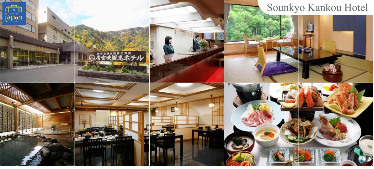
Sounkyo Kankou Hotel

รับประทานอาหารเช้า ณ ห้องของโรงแรม (2) SOUNKYO KANKOU HOTEL หรือเทียบเท่าระดับเดียวกัน หลังอาหารให้ท่านได้ผ่อนคลายกับการแช่น้ำแร่ธรรมชาติ เชื่อว่าถ้าได้แช่น้ำแร่แล้ว จะทำให้ผิวพรรณสวยงามและช่วยให้ระบบหมุนเวียนโลหิตดีขึ้น