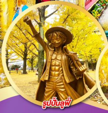
รูปปั้นสุพี