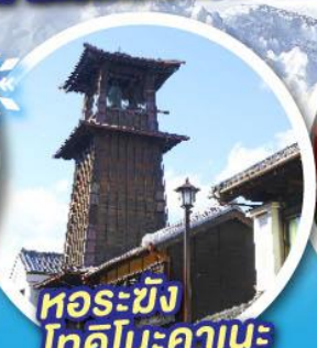
หอรบั้ง โทคิโนะคานะ