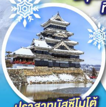
ปราสาทมัสซึโมโด้

สนุกสนานกับกิจกรรมลานสกี ที่ Ikenotaira Ski resort