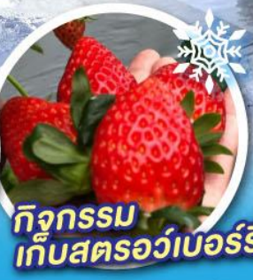
กิจกรรม เก็บสตอว์เบอร์รี่