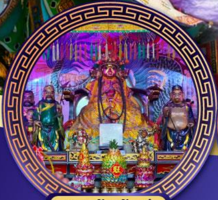
ศาลเจ้าหั่งเจีย