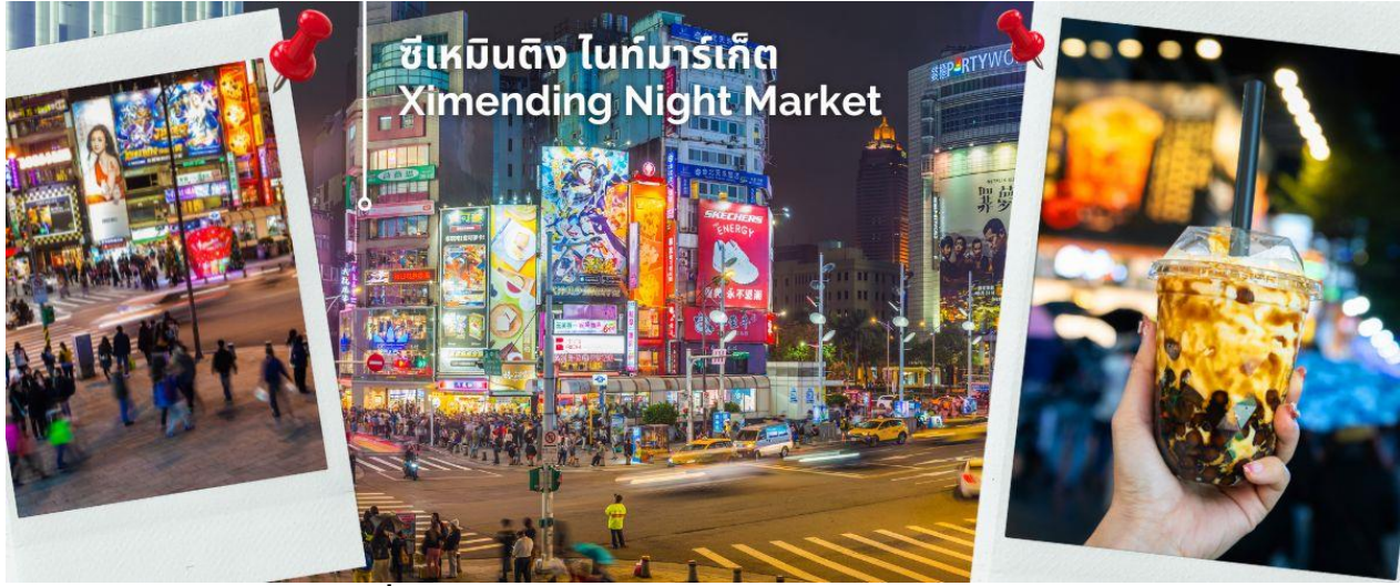
ซีเหมินติง ไทเป Ximending Night Market

ค่า อิสระอาหารค่ำ เพื่อให้ทุกท่านเต็มที่กับการช้อปปิ้งซึ่งไกด์จะแนะนำร้านอาหารร้านเด็ดร้านอร่อยให้