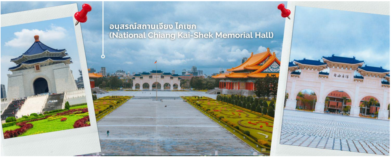
อนุสรณ์สถานเจียง ไคเชก (National Chiang Kai-Shek Memorial Hall)

ถูกสร้างขึ้นมาตามแบบสถาปัตยกรรมจีนโบราณ บันไดทั้งสี่ด้านถูกสร้างด้วยหินอ่อนสีขาวเป็นขั้นตามแบบพีระมิดอียิปต์ หลังคาสีน้ำเงิน รวมทั้งยังมีสวนดอกไม้สีแดง ที่เป็นการแสดงออกทางสัญลักษณ์ให้เห็นถึงอิสรภาพ ความเท่าเทียม และความเป็นหนึ่งเดียวกัน ตามลัทธิของชาติไต้หวัน