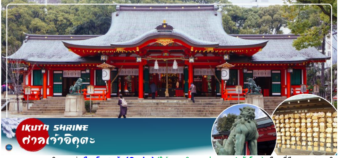
IKUTA SHRINE ศาลเจ้าอิคุตะ

จากนั้นนำท่านสักการะ ศาลเจ้าอิคุตะ (Ikuta Shrine) ตั้งอยู่ในย่านใจกลางเมืองซันโนะมียะ (Sannomiya) เป็นศาลเจ้าที่มีประวัติศาสตร์ยาวนาน ก่อตั้งในปี 201 หนึ่งในสามศาลเจ้าหลักของ โกเบที่มีประวัติศาสตร์ยาวนานกว่า 1,800 ปี ทางเหนือไปตามถนนชื่อถนนอิคุตะ คุณจะเห็นทางเข้า ศาลเจ้าพร้อมประตูโทริอิที่สร้างโดยใช้วัสดุรีไซเคิลจากศาลเจ้าใหญ่อิเสะ ศาลเจ้าอิคุตะมีชื่อเสียงใน ด้านผลประโยชน์ในการจับคู่ เนื่องจากจิตอาหิ อนุชนเป็นเทพเจ้าผู้ทอเสื้อผ้าของเทพเจ้า และเธอ ทอด้ายและด้ายเข้าด้วยกัน คนในพื้นที่เรียกกันอย่างเสนาหว่า "อิคุตะซัง"