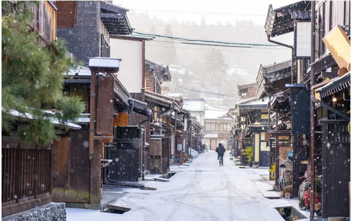
คำ อิสระอาหารตามอรรถาัย เพื่อความสะดวกในการท่องเที่ยว พักที่ CHISAN GRAND TAKAYAMA หรือเทียบเท่า