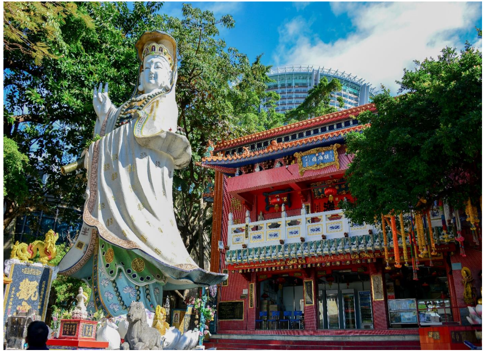
หน้าที่ 7 | ภาพประกอบใช้เพื่อการโฆษณาเท่านั้น

นำท่านเดินทางสู่ ชายหาดรีพลัสเบย์ นมัสการ เจ้าแม่กวนอิม วัดทินหัว เจ้าแม่กวนอิมริมทะเล ปาง ประทานพร ที่ศักดิ์สิทธิ์ที่สุด ไม่ว่าจะขอพรเรื่องอะไรก็จะสมปรารถนาทุกเรื่อง **ทริคในการขอพร คือ ให้ ท่านอธิฐานขอพรโดยการยื่นตรงแผ่นกระเบื้องตรงกับพระพักตร์องค์เจ้าแม่กวนอิม ตั้งจิตอธิฐาน บอกชื่อ นามสกุล ที่อยู่ บอกกล่าวท่านว่าขอพรเรื่องอะไร ขอได้ 1 ข้อ ให้กับตัวเองเท่านั้น เมื่อขอพรเสร็จให้เงย หน้าขึ้นมองที่พระพักตร์ของท่าน แล้วพรนั้นจะสมปรารถนา** ต่อด้วยนมัสการ เจ้าแม่ทับทิม ขอพรให้ แคล้วคลาดปลอดภัยในการเดินทาง ไหว้ขอโชคขอลาภ ความร่ำรวย จาก เทพเจ้าไฉซึ่งเอี้ย หรือเทพเจ้า แห่งโชคลาภ ณ สถานที่แห่งนี้ยังขึ้นชื่อเรื่องการขอบุตรธิดาขอให้มีลูกสืบทอดสกุล โดยให้ท่านขอจาก พระสังกัจจายน์ ต่อด้วย ข้ามสะพานต่ออายุ ที่เชื่อกันว่าเดินข้ามสะพาน 1 ครั้งต่ออายุได้ 3 ปี โดยท่าน จะต้องไม่เดินข้ามกลับมาเด็ดขาดมิเช่นนั้นอายุจะสั้นลงไป 3 ปี ขอพร เทพเจ้าแห่งความรัก ให้ท่านสมหวัง กับความรัก จากนั้นนำท่านรับพลังงานดวงจ्यू ณ ศาลาแปดทิศ ที่ถือว่าเป็นจุดรับพลังงานที่ดีที่สุดของ ฮ่องกง