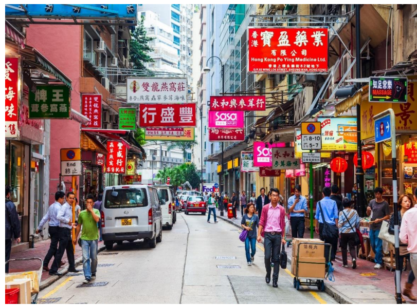
หน้าที่ 4 | ภาพประกอบใช้เพื่อการโฆษณาเท่านั้น

14.00 น. ✈️ ทัศนพาสู่ ประเทศฮ่องกง โดยเที่ยวบิน EK 384 บริการอาหารและเครื่องดื่มบนเครื่อง 18.05 น. ถึงสนามบิน CHEK LAP KOK ประเทศฮ่องกง หลังผ่านพิธีการตรวจคนเข้าเมือง อิสระให้ท่านเดินเล่นช้อปปิ้ง ย่านจิมซาจู้ ถนนนาธาน ซึ่งเป็นแหล่งรวบรวมสินค้าต่างๆมากมาย ไม่ว่าจะเป็นกระเป๋า รองเท้า น้ำหอม เครื่องสำอางค์ นาฬิกา เสื้อผ้า เครื่องประดับ ทั้งแบรนด์เนมชื่อดังระดับโลกหรือ แบรนด์ท้องถิ่นที่มีชื่อเสียง ณ ที่แห่งนี้ท่านจะได้เลือกซื้อสินค้าประเภทต่างๆ อย่างเต็มอรรถุใจ