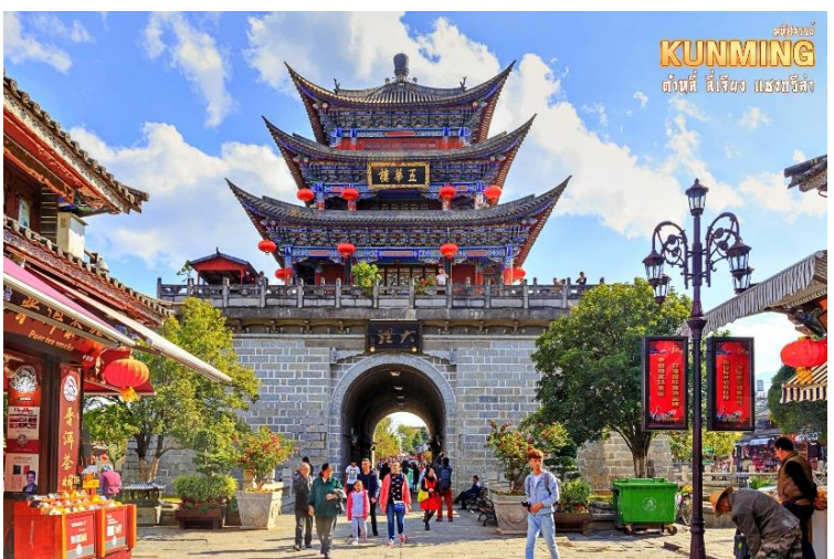
KUNMING ต้าหลี่ กู่เจิง แฉงกรีล่า

จากนั้น นำท่านย้อนอดีตสัมผัส เมืองโบราณต้าหลี่ (ต้าหลี่กุ่เจิง) เป็นเมืองเอกของเขตปกครองตนเองชนชาติป๋าย มีชนกลุ่มน้อยอาศัยอยู่กว่า 20 ชาติพันธุ์ เอกลักษณ์การแต่งกายของผู้คนที่นี่ คล้ายคลึงกับพี่น้องชาวเขาในภาคเหนือของบ้านเรา แม้ในอดีตเมืองแห่งนี้จะ