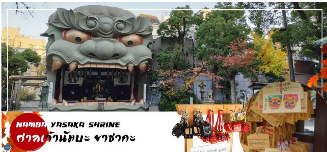
NAMBA YASAKA SHRINE ศาลเจ้านัมมะ ยาซากะ

นำทุกท่านเช็คอินจุดถ่ายรูปที่ ศาลเจ้านัมมะยาซากะ (Namba Yasaka Shrine) ตั้งอยู่ในย่านนัมมะของเมืองโอซาก้า ไฮไลท์ของศาลเจ้าแห่งนี้ คือรูปปั้นหน้าสิงโตอัปปากขนาดใหญ่ ที่เชื่อกันว่า สามารถกลืนกินปีศาจร้าย หรือ สิ่งไม่ดีทั้งหลาย ให้หายไป และนำพามาซึ่งความโชคดีให้แก่ผู้คน ปัจจุบันนักเรียน นักศึกษา และผู้ประกอบการธุรกิจนั้น นิยมมาขอพรให้ประสบความสำเร็จกันที่นี่ ด้วยความสูง 17 เมตร ความกว้าง 11 เมตรและความลึก 7 เมตร อีสระให้ทุกท่านสักการะ และเก็บภาพที่ ศาลเจ้านัมมะ ยะชะกะ