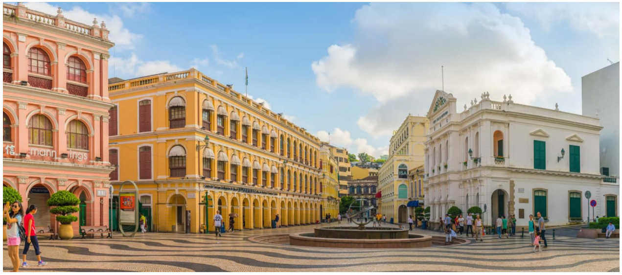
เซนาโต้ สแควร์ SENADO SQUARE

ออกแบบโดยสถาปนิกชาวอิตาลี ด้านหลังของโบสถ์มีพิพิธภัณฑ์จัดแสดงประวัติศาสตร์ของโบสถ์แห่งนี้ไว้ โบสถ์เซนต์ปอลได้รับการยกย่องให้เป็นอนุสาวรีย์แห่งศาสนาคริสต์ที่ยิ่งใหญ่ที่สุดในดินแดนตะวันออกไกล