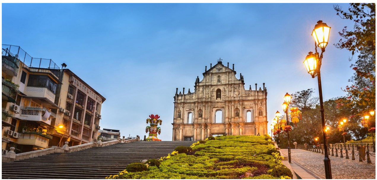
วิหารเซนต์ปอล

ออกแบบโดยสถาปนิกชาวอิตาลี ด้านหลังของโบสถ์มีพิพิธภัณฑ์จัดแสดงประวัติศาสตร์ของโบสถ์แห่งนี้ไว้ โบสถ์เซนต์ปอลได้รับการยกย่องให้เป็นอนุสาวรีย์แห่งศาสนาคริสต์ที่ยิ่งใหญ่ที่สุดในดินแดนตะวันออกไกล