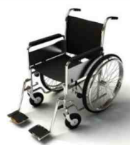
การรับการดูแลเป็นพิเศษ

กรณีผู้เดินทางต้องการความช่วยเหลือเป็นพิเศษ อาทิเช่น การใช้วีลแชร์ กรุณาแจ้งบริษัทฯ อย่างน้อย 7 วันก่อนการเดินทาง มิฉะนั้นบริษัทฯ จะไม่สามารถจัดการล่วงหน้าได้ เนื่องจาก การจองใช้วีลแชร์ในสนามบินนั้น ต้องมีขั้นตอนในการขอล่วงหน้า และบางสายการบินอาจมีการเรียกเก็บค่าใช้จ่ายทั้งทางสนามบิน ในไทยและในต่างประเทศ ซึ่งผู้เดินทางสามารถสอบถามกับเจ้าหน้าที่ได้โดยตรงก่อนทำการจอง และหากใน คณะของท่านมีผู้ต้องการดูแลพิเศษ เช่น ผู้ที่นั่งรถเข็น (Wheelchair), เด็ก, ผู้สูงอายุและผู้ที่มีโรคประจำตัว หรือไม่สะดวกในการเดินทางท่องเที่ยวในระยะเวลายาวเกินกว่า 4 - 5 ชั่วโมงติดต่อกัน ท่านและครอบครัวต้อง ให้การดูแลสมาชิกภายในครอบครัวของท่านเอง เนื่องจากการเดินทางเป็นหมู่คณะ หัวหน้าทัวร์มีความ จำเป็นต้องดูแลคณะทัวร์ทั้งหมด