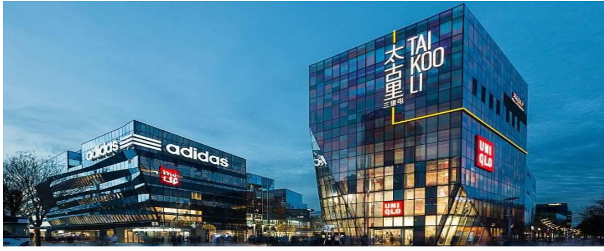
SHCAPEK36 ปักกิ่ง กำแพงเมืองจีนจวีหยงกวน เล่นสกีจวินตุชาน 5 วัน 4 คืน ๕.ค.67 CA (260824) 7

เที่ยง ๑๐) รับประทานอาหารกลางวันที่ภัตตาคาร เมนูพิเศษ...อาหารว่างตั้ง+โชว์เปลี่ยนหน้าฉากส่วนตัว บ่าย นำท่านเดินทางสู่ ถนนโบราณหนานหลิวคู่เซียง เป็นถนนคนเดินที่มีขนาดใหญ่และมีชื่อเสียงมากของกรุงปักกิ่ง ย่านเก่าแก่ของใจกลางกรุงปักกิ่งมีสถาปัตยกรรมแบบดั้งเดิมทั้งเก่าและใหม่ อาคารบ้านเรือนของที่นี่มีอายุหลายร้อยปี ตรอกซอกซอยที่เก่าแก่ที่สุดในกรุงปักกิ่ง ต่อมาย่านหนานไหล่วู่เซียง ได้ดัดแปลงเป็นร้านค้า แต่ก็ยังคงความเก่าแก่ของแบบบ้านโบราณไว้ ค่ำ ๑๐) รับประทานอาหารค่ำที่ภัตตาคาร เมนูพิเศษ...สุกี้หม้อไฟ นำท่านเดินทางสู่ ย่านซานหลี่ถุน ถือเป็นย่านช้อปปิ้งย่านกินย่านเที่ยวที่มีชื่อเสียงมากแห่งหนึ่งในกรุงปักกิ่งเมืองหลวงของจีน หรือเรียกว่า สยามสแควร์ปักกิ่ง และไม่พลาดกับร้าน ART TOYS ยอดฮิตกับ ร้าน 52 TOYS, POP MART กระจกใสสวยงามแน่นอนกับเหล่าของเล่นสุดน่ารักและเป็นกระแส ให้ท่านได้เลือกซื้อป๊อง