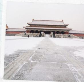
พระราชวังกุ๊กง