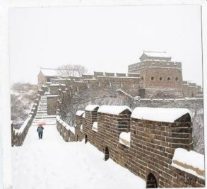
กำแพงเมืองจีน ด่านฉวิหยงกวน