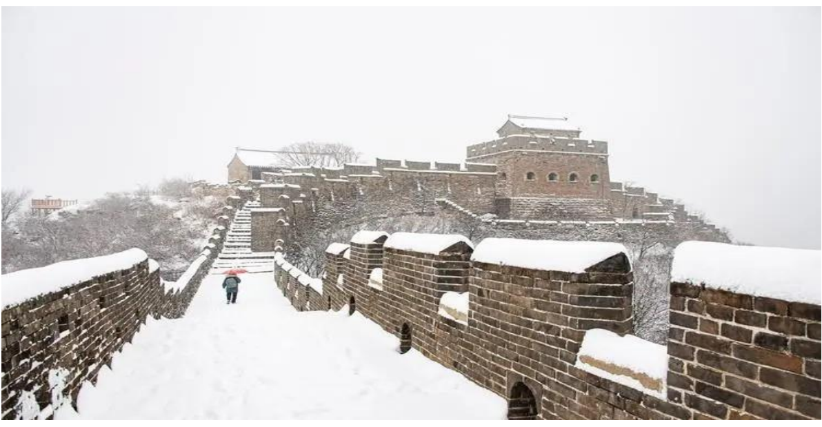
SHCAPEK36 บั๊กกิ้ง กำแพงเมืองจีนจวิหยงกวน เล่นสกีจวินดูซาน 5 วัน 4 คืน ๕.ค.67 CA (260824) 5

เช้า รับประทานอาหารเช้า ณ ห้องอาหารโรงแรม นำท่านเดินทางสู่ กำแพงเมืองจีนด่านจวิหยงกวน เป็นกำแพงที่มีป้อมคั่นเป็นช่วง ๆ ของจีนสมัยโบราณ สร้างในสมัยพระเจ้าจินซีฮ่องเต้เป็นครั้งแรก กำแพงส่วนใหญ่ที่ปรากฏในปัจจุบันสร้างขึ้นในสมัยราชวงศ์หมิง ทั้งนี้เพื่อป้องกันการรุกรานจากพวกมองโกล และพวกเติร์ก มีความยาวทั้งหมดถึง 6,350 กิโลเมตร นับเป็น 1 ใน 7 สิ่งมหัศจรรย์ของโลก