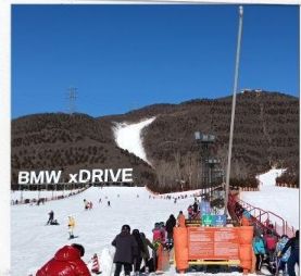
เล่นสกีจวินตุชาน