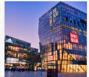
ซานหลี่ถุน