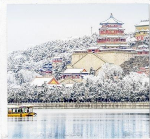
พระราชวังฤดูร้อน อวิเหอหยวน