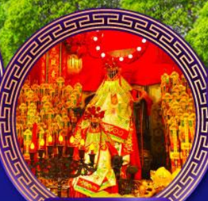
วัดเจ้าแม่กวนอิม ช่องซ่า