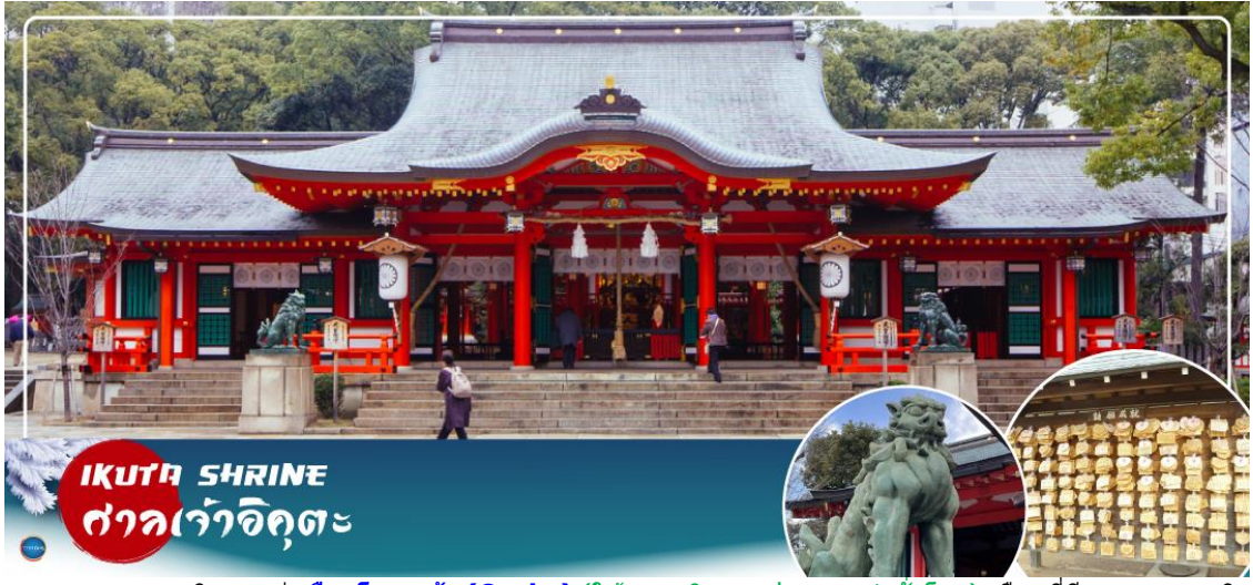
IKUTA SHRINE ศาลเจ้าอิคุตะ

จากนั้นนำท่านสักการะ ศาลเจ้าอิคุตะ (Ikuta Shrine) ตั้งอยู่ในย่านใจกลางเมืองซันโนะมียะ (Sannomiya) เป็นศาลเจ้าที่มีประวัติศาสตร์ยาวนาน ก่อตั้งในปี 201 หนึ่งในสามศาลเจ้าหลักของ โกเบที่มีประวัติศาสตร์ยาวนานกว่า 1,800 ปี ทางเหนือไปตามถนนช็อนนอิคุตะ คุณจะเห็นทางเข้า ศาลเจ้าพร้อมประตูโทริอิที่สร้างโดยใช้วัสดุรีไซเคิลจากศาลเจ้าใหญ่อิเสะ ศาลเจ้าอิคุตะมีชื่อเสียงใน ด้านผลประโยชน์ในการจับคู่ เนื่องจากจิตอาหิ อนุชนเป็นเทพเจ้าผู้ทอเสื้อผ้าของเทพเจ้า และเธอ ทอด้ายและด้ายเข้าด้วยกัน คนในพื้นที่เรียกกันอย่างเสนาหว่า "อิคุตะซัง"