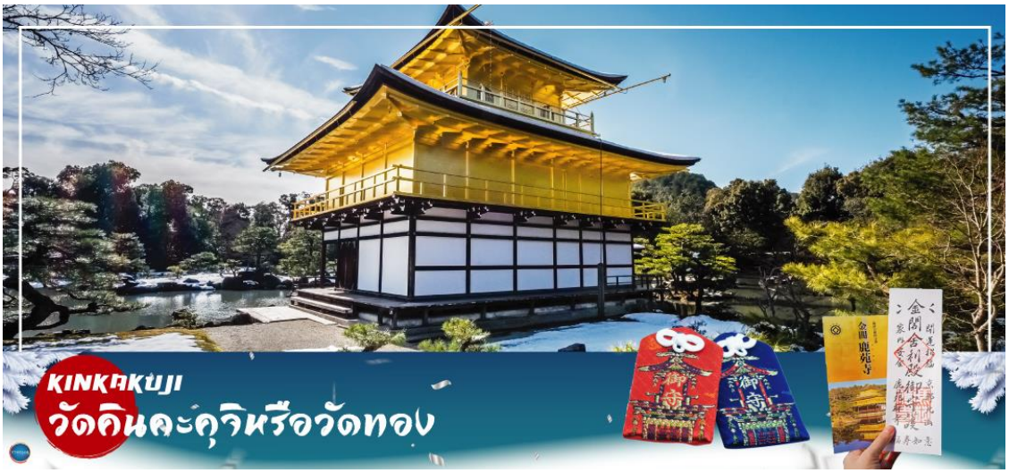
KINKAKUJI วัดคินคะคุจิหรือวัดทอง

วันที่สาม เมืองโอซาก้า – เมืองเกียวโต – วัดคินคะคุจิ – การเรียนพิธีชงชาญี่ปุ่น – วัดคิโยมิตสึเดระ – ย่านฮิกาชิยาม่า – เมืองโอซาก้า – ซ้อปปิงชินไซบาชิ