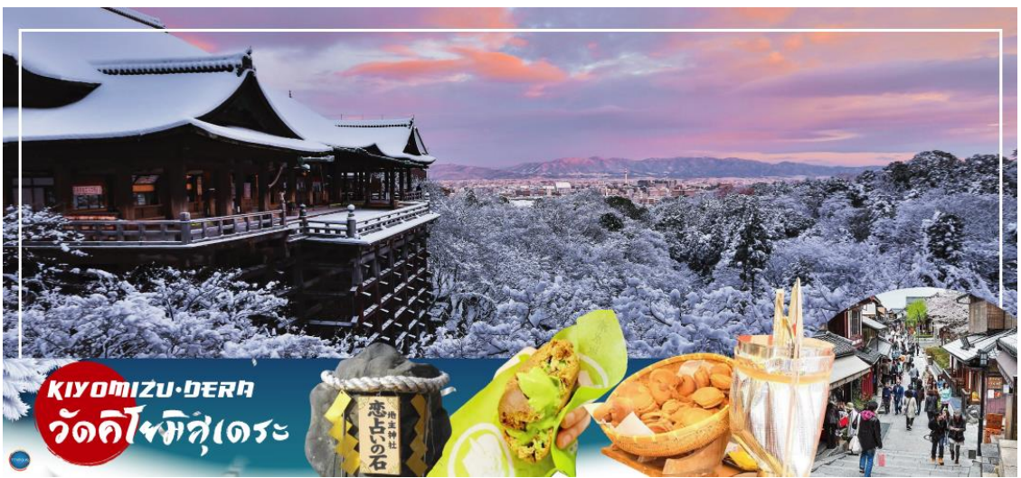
KIYOMIZU-DERA วัดคิโยมิตสึเดระ

เที่ยง รับประทานอาหารกลางวัน ณ ภัตตาคาร (4)