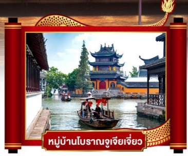
หมู่บ้านโบราณจูเจียเจี๋ย

เดินทางโดยสายการบิน : สายการบินไทย อาหาร : 9 มื้อ โรงแรม : 4 ดาว