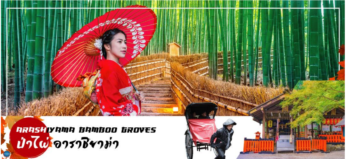
ARASHIYAMA BAMBOO GROVES ป่าไผ่ อาราชิยาม่า