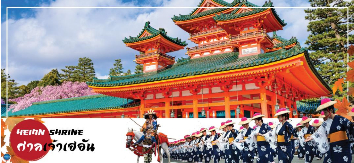
HEIAN SHRINE ศาลเจ้าเฮอัน

วันที่ทำ เมืองนาโกย่า – เมืองเกียวโต – ศาลเจ้าเฮอัน – การเรียนพิธีชงชาญี่ปุ่น – เมืองโอซาก้า – LALAPORT & MITSUI OUTLET PARK OSAKA KADOMA – ช้อปปิ้งชินไซบาชิ