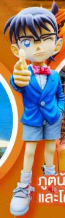
กตน้อย คิตาโร่ และโคนัน