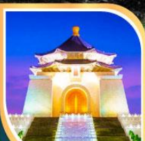
เจียงโกเช็ก