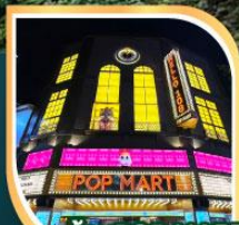
ร้านPOP MART ที่ใหญ่ที่สุดในไต้หวัน