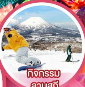
กิจกรรมลานสกี