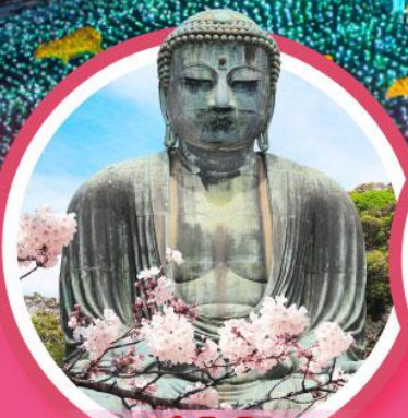
หลวงพ่อดโตโดบุตสึ

ชมเทศกาลดอกซากุระบานในคาวาซุ ชมงานประดับไฟ 1 ใน 3 ของญี่ปุ่น อิซุโคกัน แกรนด์อิลลูมิ พักออนเซ็น 2 คืน/ พักโตเกียว 2 คืน