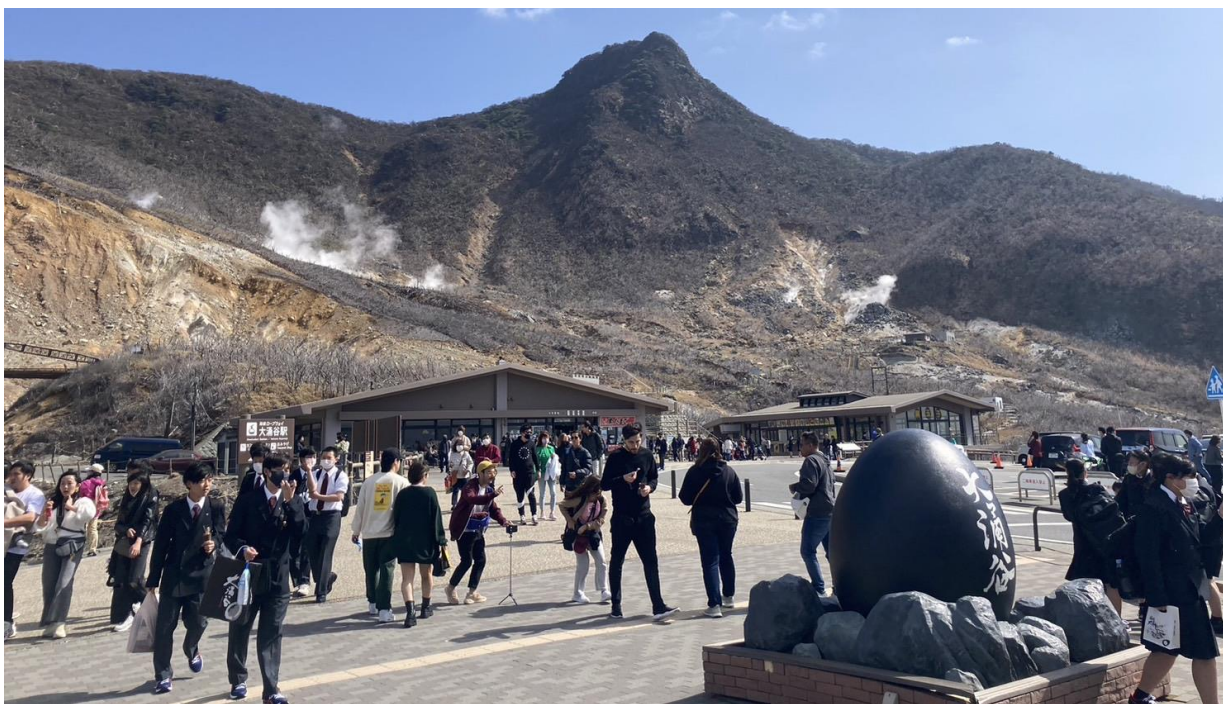
GO2NRT-TG063- TOKYO KAWAZU SAKURA GRAND ILLUMINATION 6D 4N

หุบเขาโอวาคุดานิ (Owakudani) หุบเขาที่เกิดจากการระเบิดของภูเขาไฟฮาโกเน่เมื่อประมาณ 3,000 ปี ก่อน พาท่านมาลิ้มรสไข่ดำที่มาจากน้ำพุร้อนธรรมชาติ ด้านนอกของเปลือกไข่จะเป็นสีดำเนื่องจากถูกแร่กำมะถัน และเปล็ดเปลือกับการชมวิวกูเขาไฟฟูจิ