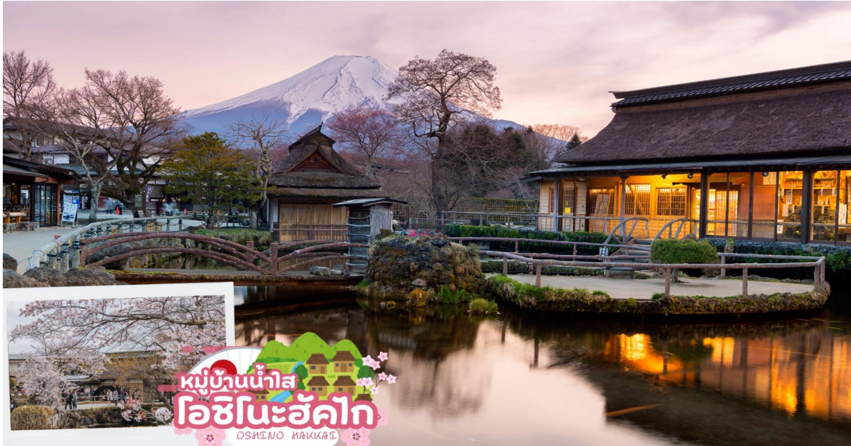
GO2NRT-TG063- TOKYO KAWAZU SAKURA GRAND ILLUMINATION 6D 4N

หมู่บ้านโอชิโนะฮักไก (Oshino Hakkai Village) เป็นจุดท่องเที่ยวที่สร้างเป็นหมู่บ้านเล็กๆ ที่มีฉากหลังเป็น ภูเขาไฟฟูจิ ประกอบด้วยบ่อน้ำ 8 บ่อในโอชิโนะ ตั้งอยู่ระหว่างทะเลสาบคาวาคุจิโกะกับทะเลสาบยามานาคาโกะซึ่งเป็นพื้นที่เก่าของทะเลสาบแห่งที่ 6 ที่แห้งขอดไปเมื่อ 200-300 ปีที่ผ่านมา บ่อน้ำทั้ง 8 นี้เป็นน้ำจากหิมะที่ละลายในช่วงฤดูร้อน ที่ไหลมาจากทางลาดใกล้ๆภูเขาไฟฟูจิผ่านหินลาวาที่มีรูพรุนอายุกว่า 80 ปี ทำให้น้ำใสสะอาดเป็นพิเศษ ถัดไปอีกบ่อหนึ่ง นักท่องเที่ยวสามารถดื่มน้ำเย็นจากแหล่งน้ำได้โดยตรง นอกจากนี้ยังมีร้านอาหาร ร้านจำหน่ายของที่ระลึก และชมรอบๆบ่อที่ชายฝั่งพักผ่อน ทาน ผักตบถ งานฝีมือ และผลิตภัณฑ์ท้องถิ่นอื่นๆ บางร้านยังขายมันเทศหวานย่าง และขนมแซมเบ้ บนเตาเล็กๆ กลางแจ้งส่งกลิ่นหอมชวนให้ลิ้มรสอีกด้วย