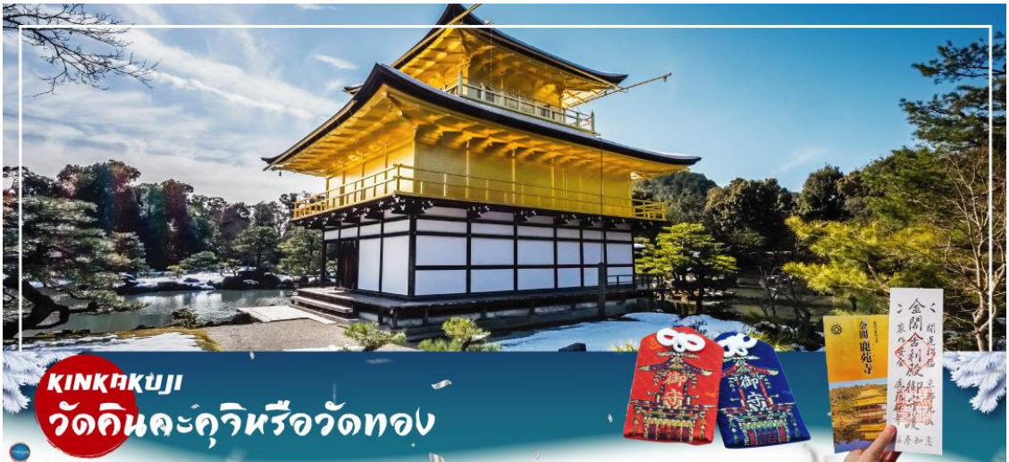
KINKAKUJI วัดคินคะคุจิหรือวัดทอง

01.15 น. เห็นฟ้าสู่ เมืองโอซาก้า ประเทศญี่ปุ่น โดยเที่ยวบินที่ XJ612 สายการบิน AIR ASIA X ใช้เครื่อง AIRBUS A330-300 จำนวน 377 ที่นั่ง จัดที่นั่งแบบ 3-3-3 (น้ำหนักกระเป๋า 20 กก./ท่าน หากต้องการซื้อน้ำหนักเพิ่ม ต้องเสียค่าใช้จ่าย) บริการอาหารและเครื่องดื่มบนเครื่อง(ราคาโปรโมชั่นไม่มีอาหารบนเครื่อง)