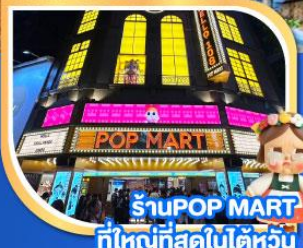
ร้านPOP MART ที่ใหญ่ที่สุดในไต้หวัน