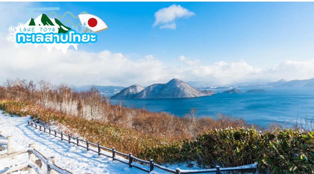
นำท่านเดินทางสู่ ทะเลสาบโทยะ (Lake Toya) เป็นทะเลสาบขนาดใหญ่รูปร่างกลมมีเส้นรอบวงยาวประมาณ 40 กิโลเมตร เกิดจากปากปล่องภูเขาไฟอูสุระเบิด ตั้งอยู่ใกล้กับ ทะเลสาบชิโกสึ (Lake

GO2CTS-XJ015 -- HOKKAIDO SNOW LAND NEW YEAR 2025 7D 5N BY XJ