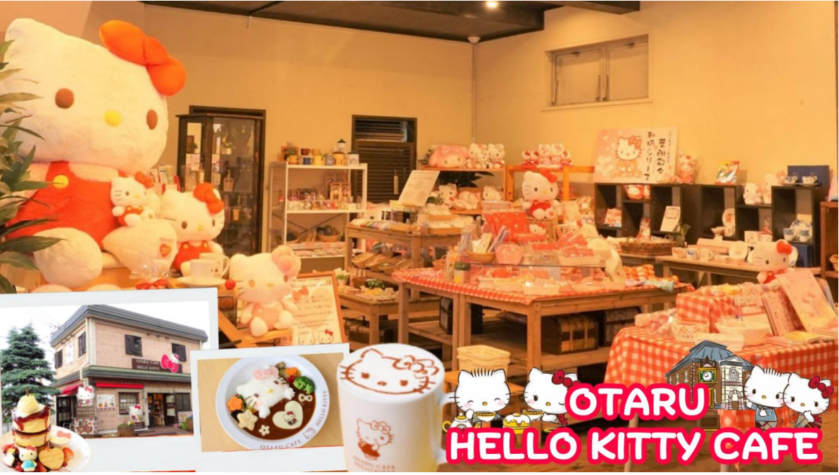
กลางวัน รับประทานอาหารกลางวัน ณ ร้านอาหาร (มื้อที่ 5)

GO2CTS-XJ015 -- HOKKAIDO SNOW LAND NEW YEAR 2025 7D 5N BY XJ