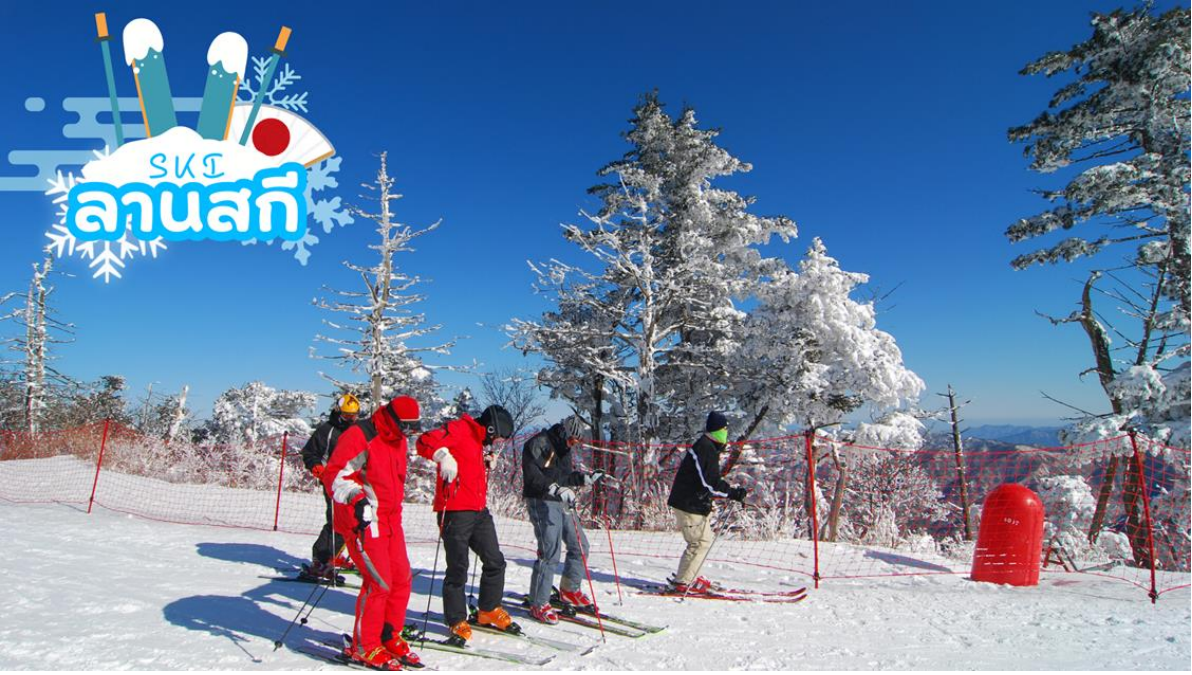
อิสระกิจกรรม ลานสกีโนแลนด์ ให้ทุกท่านได้อิสระเพลิดเพลินสนุกสนานกับกิจกรรมลานหิมะและเก็บภาพประทับใจ กลับไปอวดคนทางบ้าน **ไม่รวมอัตราค่าเช่าอุปกรณ์, ชุดสำหรับเล่นสกี, ค่าคอร์สในการเล่นกิจกรรม และ เครื่องเล่นทุกชนิด**