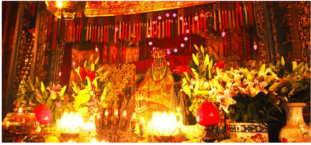
GO1HKG-HX001 ฮ่องกง เสริมสิริมงคล เปิดทองพระคลังเจ้าแม่กวนอิมฮ่องฮ่า 5 วัน 3 คืน (พัก 5 คืน) โดยสายการบิน Hong Kong Airlines (HX)

วันเปิดทองพระคลัง หรือ วันเปิดทรัพย์ สำหรับปี 2568 จะตรงกับวันที่ 23 กุมภาพันธ์ 2568 (ในแต่ละปีจะไม่ตรงกันเพราะนับจากการคำนวณตามปฏิทินจันทรคติจีน) ซึ่งทางวัดจะมีการจัดทำพิธีขอเยี่ยมเงินเจ้าแม่กวนอิม ขอพรด้านเงินทอง ความเจริญมั่งมีมั่งคั่งในชีวิต ให้ท่านได้ร่วมพิธีการศักดิ์สิทธิ์และเก่าแก่ของชาวฮ่องกงที่สืบทอดกันมา โดย 1 ปี จะมีเพียง 1 ครั้ง และในวันนี้จะมีผู้คนหลั่งไหลกันเข้ามาไหว้ขอพรกันเป็นจำนวนมาก ทั้งชาวฮ่องกงเอง ชาวจีนแผ่นดินใหญ่ รวมถึงนักท่องเที่ยวต่างชาติ ต่างก็มารอคิวข้ามคืนเพื่อต้องการเข้าร่วมทำพิธีกันอย่างมากมาย