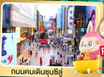
ถนนคนเดินซุนชี่ลุ