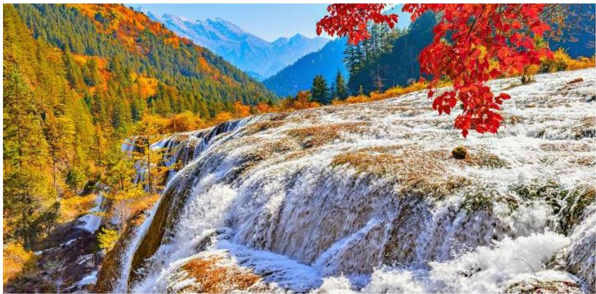
GO1TFU-TG012 เฉิงตู หวงหลง จิวจ้ายโกว ภูเขาสี่ฤดู 6วัน 5คืน โดยสายการบิน Thai Airway (TG)

น้ำตกธารไข่มุก ซึ่งเป็นน้ำตกที่ไหลผ่านถ้ำลำธารใหญ่น้อยที่สลับซับซ้อนดุจดั่งวังบาดาล โดยมีสายน้ำทอดยาวลดหลั่นกันมาเป็นระยะทางถึง 310 เมตร โดยไม่ขาดช่วงสายธารส่องประกายระยิบระยับราวกับความงามของเส้นไข่มุก ให้ท่านได้สนุกกับการบันทึกถ่ายภาพและดื่มด่ำกับธรรมชาติที่สวยงามได้อย่างเต็มที่ ถึงเวลานัดหมายออกจากอุทยาน