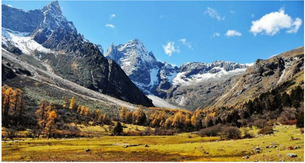
GO1TFU-TG012 เฉิงตู หวงหลง จิว่จ้ายโกว ภูเขาสี่ดรุณี 6วัน 5คืน โดยสายการบิน Thai Airway (TG)

จากนั้นนำท่านเดินทางสู่ ภูเขาสี่ดรุณี(รวมรถอุทยาน) “สี่ดรุณี” หรือ ชื่อภูเขาหนึ่งขาน ตั้งอยู่ในมณฑลเสฉวน ประเทศจีน เป็นยอดเขา 4 ลูกที่เรียงรายติดต่อกันไปจากทิศเหนือถึงทิศใต้เป็นระยะทาง 3.5 กิโลเมตร โดยมีความสูงเหนือระดับน้ำทะเลแบ่งเป็น 6,250 เมตร/ 5,664 เมตร/ 5,454 เมตร และ 5,355 เมตร บนยอดเขาทั้ง 4 แห่งนี้จะมีหิมะปกคลุมตลอดทั้งปี ทำให้ดูเหมือนส่วนสี่ระฆังที่คลุมด้วยผ้าสีขาวของหญิงสาว 4 คน จึงเป็นที่มาของชื่อ “ภูเขาสี่ดรุณี” นั่นเองพื้นที่บริเวณภูเขาสี่ดรุณีนั้นเป็นพื้นที่ขึ้นหินแบบยูคโโบราณ, เพราะเหตุผลที่ว่า ยอดเขามีลักษณะแปลกที่พบเห็นได้น้อย, บนยอดเขามีหิมะปกคลุมตลอดปี, ทำให้ได้รับฉายาว่า “ราชินีแห่งดินแดนเสฉวน” หรือ “ภูเขาศักดิ์สิทธิ์แห่งดินแดนทางทิศตะวันออก” มียอดเขาที่มีระดับความสูงน้ำทะเลสูงเกิน 5000 เมตร ถึง 61 ลูก, รอยต่อระหว่างภูเขามียอดบึงทะเลสาบอยู่ถึง 25 แห่ง มีน้ำตกอยู่ 120 กว่าแห่ง