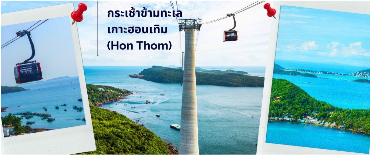
กระเช้าข้ามทะเล เกาะฮอนเทิม (Hon Thom)

นำท่านนั่ง กระเช้าข้ามทะเล Hon Thom Cable Car บรรยากาศสุดตื่นเต้นประทับใจ กับความสูงของกระเช้าและยังทอดยาว ข้ามทะเลมุ่งสู่เกาะ ฮอนเทิม (Hon Thom) เกาะที่ได้ชื่อว่าเป็นเกาะแห่งการพักผ่อนอย่างแท้จริง โดยกระเช้าแห่งนี้ได้รับการขนานนามว่า เป็นกระเช้าข้ามทะเลที่ยาวที่สุดในโลกอันดับสาม โดยมีระยะทางยาว 7,899.9 เมตร อยู่ทางฝั่งทะเลใต้ของหมู่เกาะฟูโก๊วก ตัวกระเช้าขนาดใหญ่ สามารถรองรับผู้โดยสารได้มากถึง 30 คน เคลื่อนตัวด้วยความเร็วสูงสุด 8.5 เมตร/วินาที โดยใช้เวลาประมาณ 15 นาที