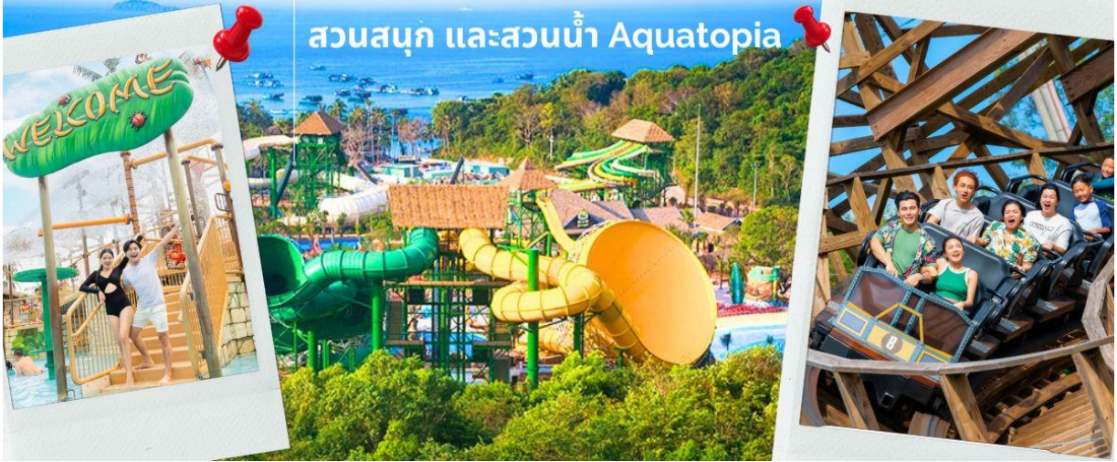
สวนสนุก และสวนน้ำ Aquatopia

จากนั้นนำท่าน ชมสวนน้ำ และสวนสนุก Aquatopia Park ที่ตั้งอยู่บนเกาะฮอนเทิม (Hon Thom) ประกอบไปด้วยสวนน้ำขนาดใหญ่ และเครื่องเล่นมากมายให้ท่านได้เลือกเล่นได้ตามใจชอบ สวนน้ำ Aquatopia ตั้งอยู่ทางตอนใต้ของเกาะฟูโก๊วก ถือเป็นสวนน้ำที่ใหญ่ที่สุดในเอเชียตะวันออกเฉียงใต้ที่มีเครื่องเล่นที่ทันสมัยมากกว่า 20 ชนิด นอกจากโซนสวนน้ำที่เหมาะสมสำหรับครอบครัวแล้ว Aquatopia Park ยังมีเครื่องเล่นที่น่าตื่นเต้นอีกมากมายให้ท่านได้เลือกเพลิดเพลิน รวมไปถึงร้านค้าจำหน่ายของฝาก และร้านอาหารมากมายให้เลือกร้านอาหาร ระหว่างเดินเที่ยวในสวนสนุกแห่งนี้