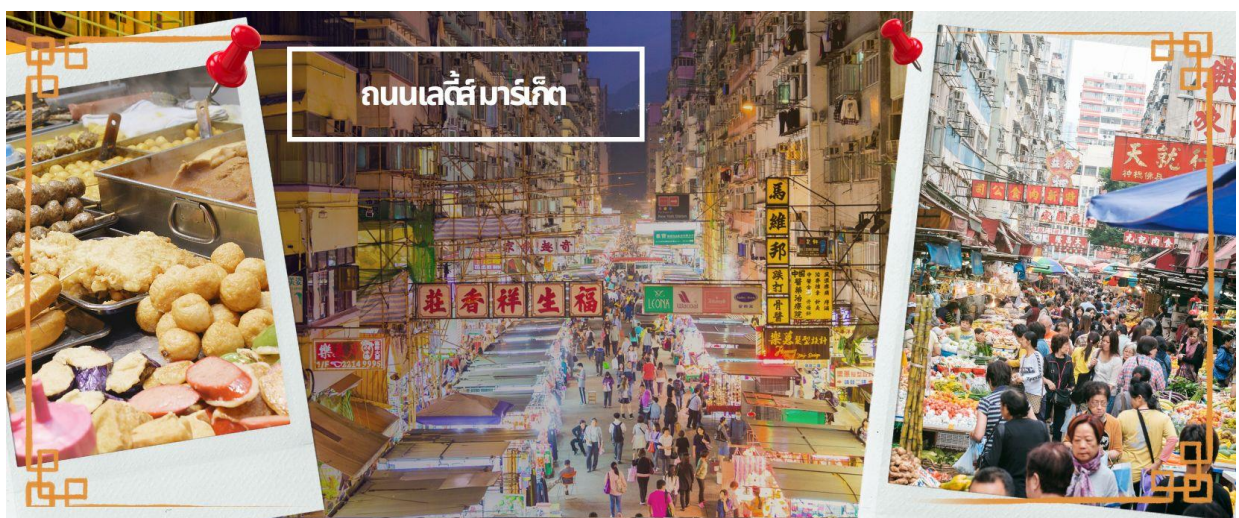
ถนนเลดี้ มาร์เก็ต

จากนั้นนำท่านเดินทางสู่ ย่านมงก๊ก เป็นย่านที่มีความคึกคักที่สุดแห่งหนึ่งในเกาะฮ่องกงก็ว่าได้ เป็นสวรรค์ของ นักช้อปปิ้งหนึ่งที่ สายช้อปปะพลาดไม่ได้ นับได้ว่าเป็นย่านช้อปปิ้งที่คึกคักมากอีกแห่งหนึ่งของฮ่องกงเพราะ เป็นย่านช้อปปิ้งที่มีทั้งร้านค้า และคนที่มาช้อปปิ้งจากที่ต่างๆ มากมายไม่ขาดสายตั้งแต่มัถงวันยันกลางคืน เป็นถนนช้อปปิ้งที่มีสีสันมาก ถ้าเทียบกับญี่ปุ่นแล้วก็เปรียบเหมือนการเดินอยู่ที่ชิบูย่าเลยก็ว่าได้ และยังมีทั้ง เครื่องสำอาง เสื้อผ้า รองเท้า กระเป๋า เครื่องประดับมากมายให้เลือกช้อป อีกทั้งยังมีร้านอาหารและเครื่องดื่ม ที่ ขึ้นชื่อหลากหลายชนิด ให้ทุกท่านได้ลองลิ้มรสอีกมากมาย