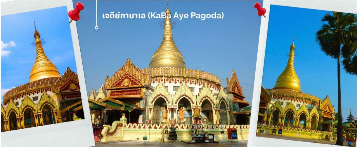
เจดีย์กาบาเอ (KaBa Aye Pagoda)

เที่ยง 10) รับประทานอาหารกลางวัน ณ ภัตตาคาร (7) เมนูพิเศษ!! เปิดปักกิ่ง+สลัดกุ้งมังกร จากนั้นนำท่าน เดินทางไปยัง เจดีย์กาบาเอ (KaBa Aye Pagoda) เพื่อร่วมพิธี เทินพระธาตุ พิธีอันศักดิ์สิทธิ์ เป็นเจดีย์ทรงกลมครบ ซึ่งมีทางเข้าทั้งหมดห้าด้านด้วยกัน นายอนุชาคนแรกของพม่า ได้สร้างขึ้นเพื่อใช้เป็นสถานที่ชำระพระไตรปิฎก สูง 34 เมตร สร้างขึ้นเมื่อปี 1952 เพื่อทำการสังคายนา พระไตรปิฎกครั้งที่ 6 เป็นเจดีย์ที่มีความสวยงามและแปลกตา ภายในบรรจุพระอัฐิธาตุของพระอัครสาวกแห่งองค์พระสัมมาสัมพุทธเจ้า คือพระโมคคัลลานะและพระสารีบุตร จะมีทางเข้าทั้งหมดห้าด้าน ทุกด้านมีพระพุทธรูปประดิษฐานอยู่บนฐานทักษิณ มีพระพุทธรูปหุ้มด้วยทองคำองค์เล็ก ๆ อีก 28 องค์ แทนอดีตสาวกของพระพุทธเจ้าทั้ง 28 องค์ ที่อุบัติขึ้นในโลกนี้ ส่วนพระพุทธรูปองค์พระประธานที่อยู่ข้างในหล่อด้วยเงินบริสุทธิ์มีน้ำหนัก กว่า 500 กิโลกรัม และ เข้าร่วมพิธีเทินพระธาตุเพื่อความ เป็นสิริมงคล