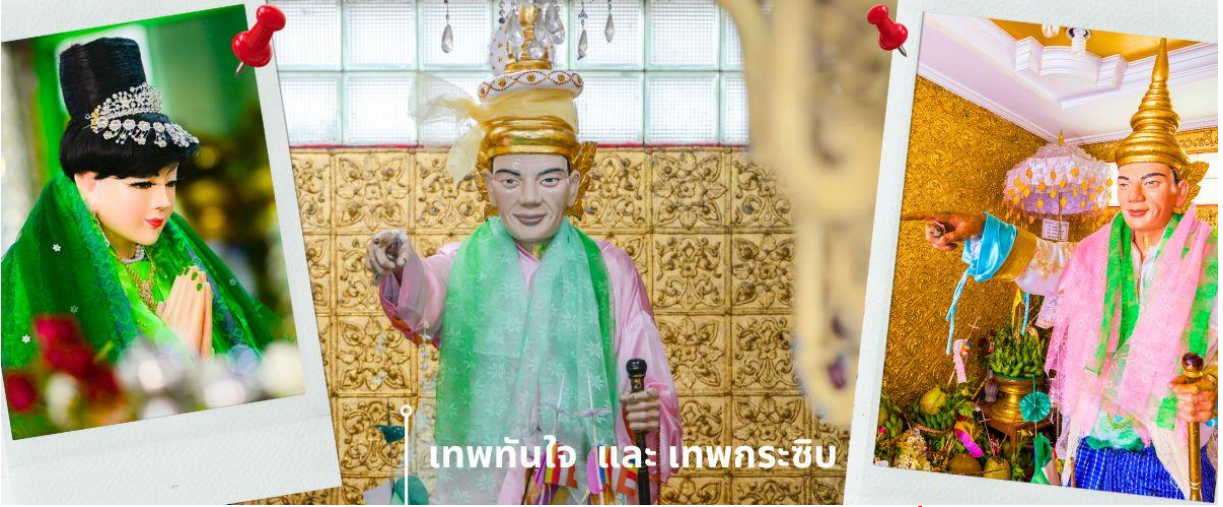
เทพทันใจ และ เทพกระซิบ

C8MR1 ย่างกุ้ง-หงสา-พระธาตุดินทร์แขวน-เจดีย์กลางน้ำลิเรียม 3 วัน 2 คืน บิน 8M (SEP-MAR25)